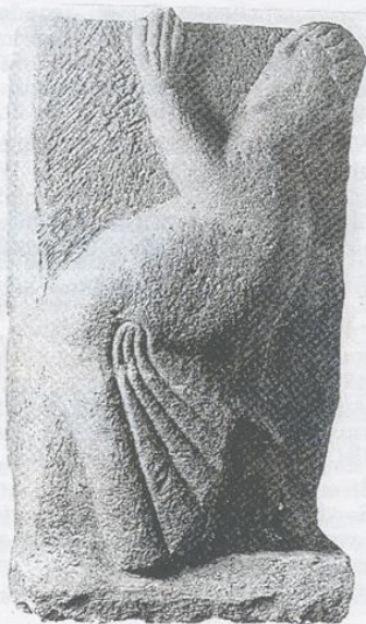
Der tanzende Mann vom Südwestturm Übernommen von Greiner

Im Jahre 1927 hat Karl Greiner nahe dem Hirsauer Eulenturm im Boden zwei Bildwerke gefunden, von denen anzunehmen ist, dass sie an dem zerstörten zweiten Westturm angebracht und