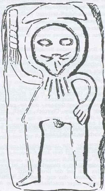
Das Kapuzenmännlein von Hemmendorf Übernommen von Weitnauer

Bei diesem Genius handelt es sich um einen keltischen Heilgott .