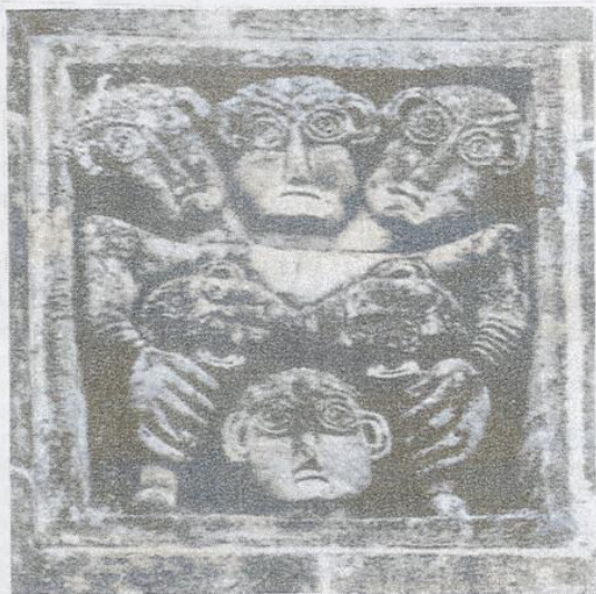
Der Dreikopf von Maursmünster Übernommen von Georg Troescher

Frage : Passt das in die christliche Formenwelt ?