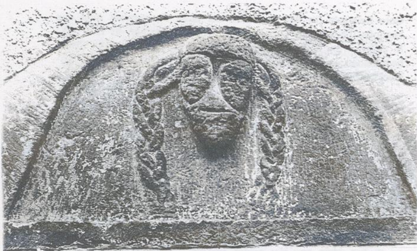
Das Dreigesicht von Forchtenberg Übernommen von Georg Troescher