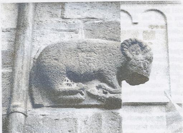
Der zusammenbrechende Widder von Dorlisheim

In einem vor einiger Zeit im Fernsehen gezeigten Kulturfilm über Nordafrika wurde eine Szene gezeigt , in der Schafe geschlachtet wurden : Die Tiere sanken nach durchschnittener Kehle langsam in die Knie und fielen dann ganz zu Boden , wo sie vollends ausbluteten, ein für einen Mitteleuropäer grausiger Anblick.