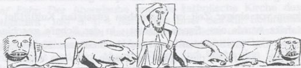
Die zusammenbrechenden Tiere an der Westseite Übernommen von Fastenau

men; ... die Tiere nehmen alle in ähnlicher Weise eine fast kniende Stellung ein; ... kauern Böcke ; ... das Tier ist auf die Vorderbeine heruntergegangen , auf den hinteren steht es noch .