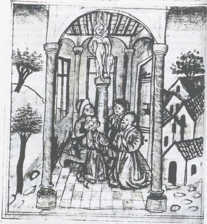
Anbetung der Göttin Zisa in Augsburg Übernommen aus Alfred Weitnauer, Keltisches Erbe in Schwaben und Baiern 1961

tere wird mit übereinander gelegten, keineswegs gefalteten Händen gezeigt. Diese Geste wird sinnvoll, wenn sie sich auf einen ehemals vorhanden gewesenen Gegenstand, wie Stab oder Stock, abstützt. Die Halbfigur bekäme dann den Habitus eines Hirten, von dem es bei Jesaias 11, 6 heißt: "Ein kleiner Knabe kann sie hüten!" Das Heilszeichen Kreuz im Kreis steht für Frieden und Erlösung.