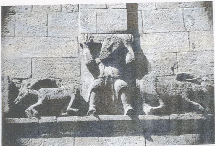
Der Fries am Hirsauer Eulenturm , Südseite Übernommen von Emil Bock

beide Hände behäbig auf die Knie gestützt, ebenfalls ein bärtiger Mönch. Die Mönchsfiguren sind kurze, gedrungene Gestalten, an allen drei Seiten in Vorderansicht, in gleicher Tracht und mit langen, spitz zulaufenden Kinnbärten dargestellt. Bei dem Mönch, der die Lisene trägt, ist die Kutte an den Beinen fast bis zum Knie hinaufgeschoben, so dass die stämmigen Unterschenkel sichtbar werden. Dasselbe Motiv kehrt bei den sitzenden Mönchen wieder, bei denen jedoch nur der linke Unterschenkel entblößt ist. Die wenigen, ganz schematisch wiederholten Faltenzüge, wie z. B. die beiden Falten an der Brust, hat der Steinmetz bei allen drei Figuren ängstlich wiederholt, auch der Gesichtstypus ist fast nicht variiert. Die Figuren sind sämtlich ohne Kopfbedeckung. Eine Haartracht ist nur bei dem Mönch auf der Südseite mit Sicherheit zu erkennen; sie besteht aus breiten, parallel nebeneinander liegenden und auf die Stirn herabfallenden Strähnen. Die im Durchschnitt etwa 1 m hohen Relieffiguren, die im Einzelnen betrachtet, roh und ungefügt geformt erscheinen, üben als Ganzes eine derbkräftige dekorative Wirkung aus.