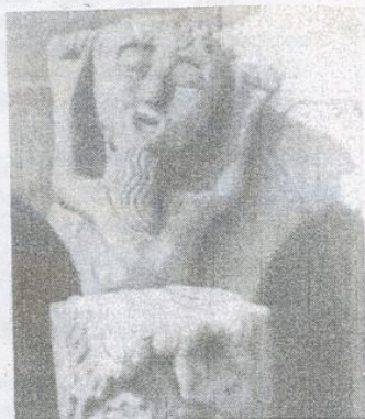
Abb. 164. Unhold vom Turm der Johannes- Kirche in Schwäbisch Gmünd.

Beispiele für geknickt erhobene Arme gibt es auch aus dem Mittelalter, so den an der Apsis der romanischen Kapelle in Schwärzloch bei Tübingen abgebildeten Mann (Weitnauer, Bildertafel 24). An einer Säule der Johanniskirche von Schwäb. Gmünd hebt ein bärtiges Männlein beide Arme in die Höhe (Weitnauer, Bildertafel 25).