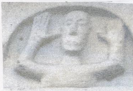
Die Figur an der Schwärzlochler Kapelle Übernommen von Jung

Tac. Annal. XIV, 30 : Am Rand der Insel standen die feindlichen Reihen, Waffe an Waffe und Mann an Mann, ringsherum die Druiden, die Hände zum Himmel erhoben, Bitten und Beschwörungen aussprechend. Der ungewohnte Anblick erschreckte unsere Soldaten. Wie gelähmt sahen sie sich den feindlichen Waffen ausgesetzt.