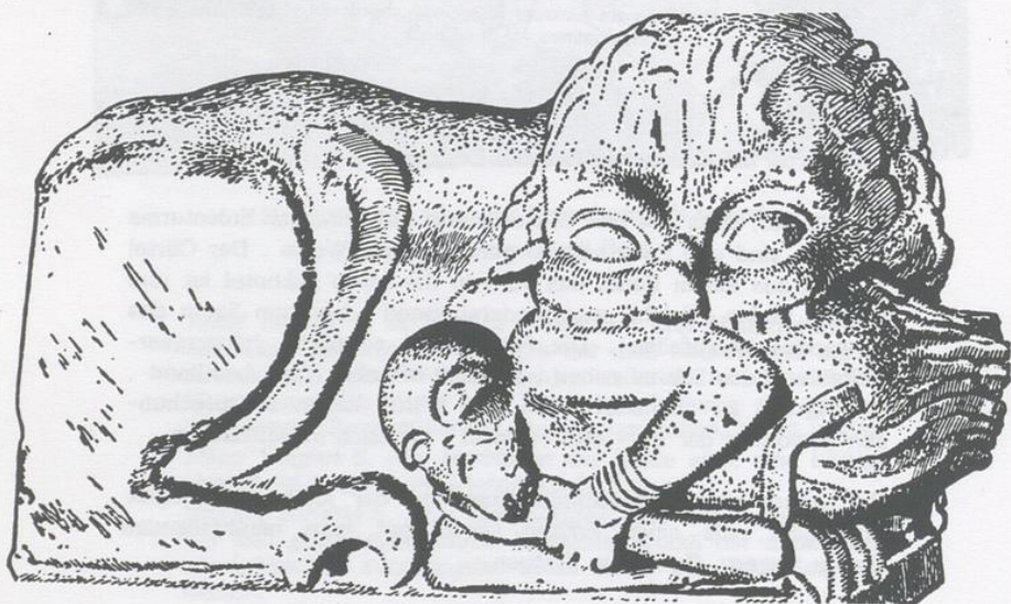
Der Löwe mit dem Heidenpriester Übernommen aus Erich Jung , Mannus 20, 1928

Jung 1939 S. 388 : Bei den drei Hirsauer Gestalten ist der Gürtel sehr deutlich hervorgehoben, ebenso bei den beiden Figuren an den Säulenfüßen von Speyer ( Abb. 159 ) und München.