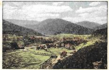
Blick vom Falkenstein