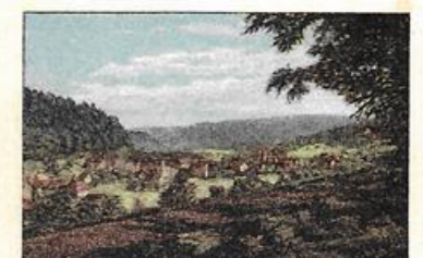
Blick vom Klausenweg