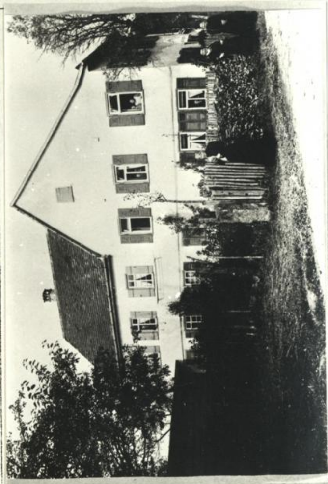
Abb. 2 "Ziegelhütte" um 1920 abgebrannt