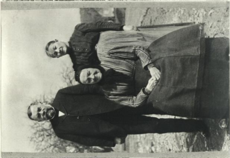
Abb. 4 Stanger mit Frau u. Mutter sitzend