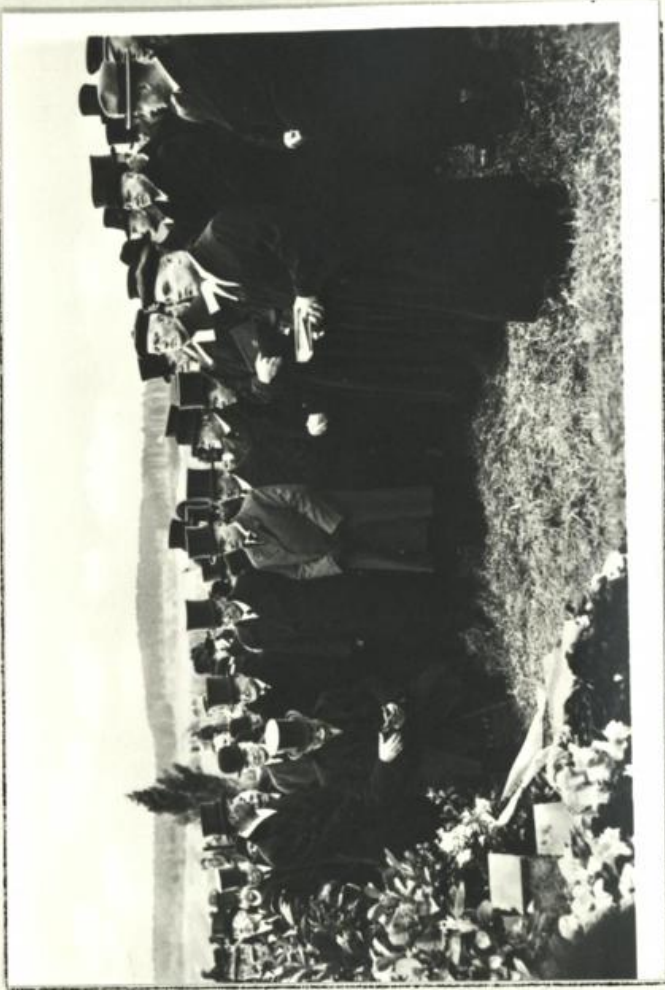
Abb. 9 Beerdigung (Pfr.) Vöhringer