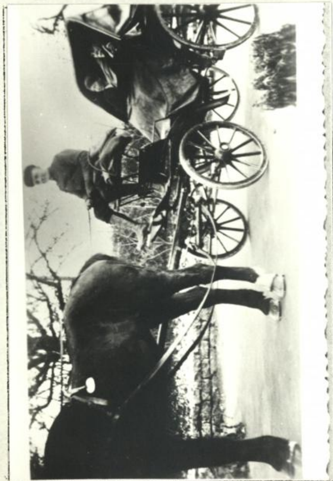
Abb. 8 Stanger im Chaisle