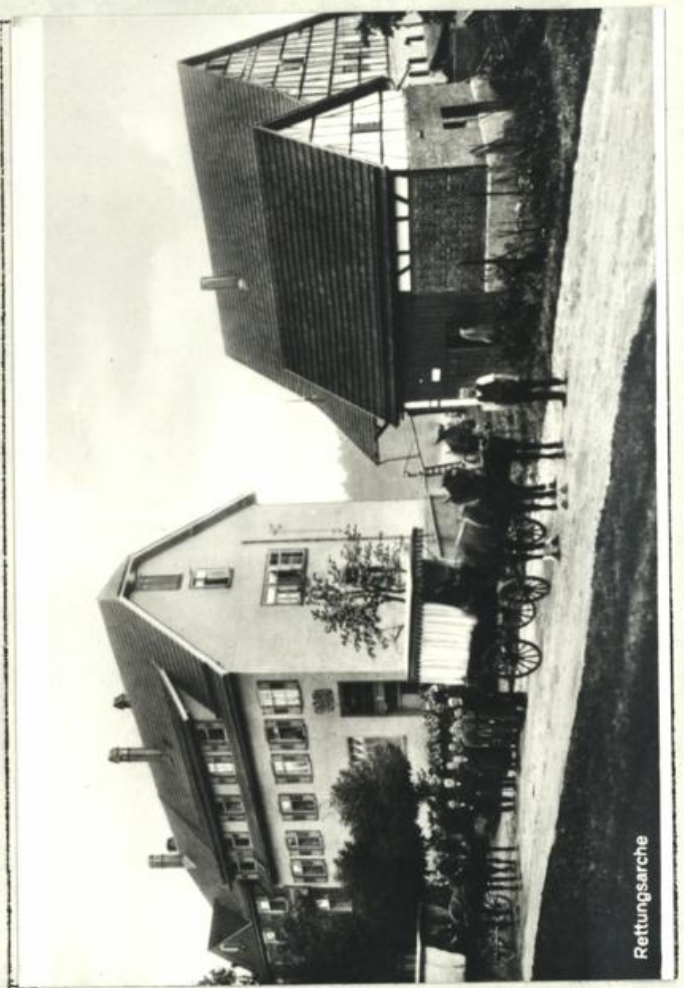
Abb. 7. "Rettungsarche" 1926