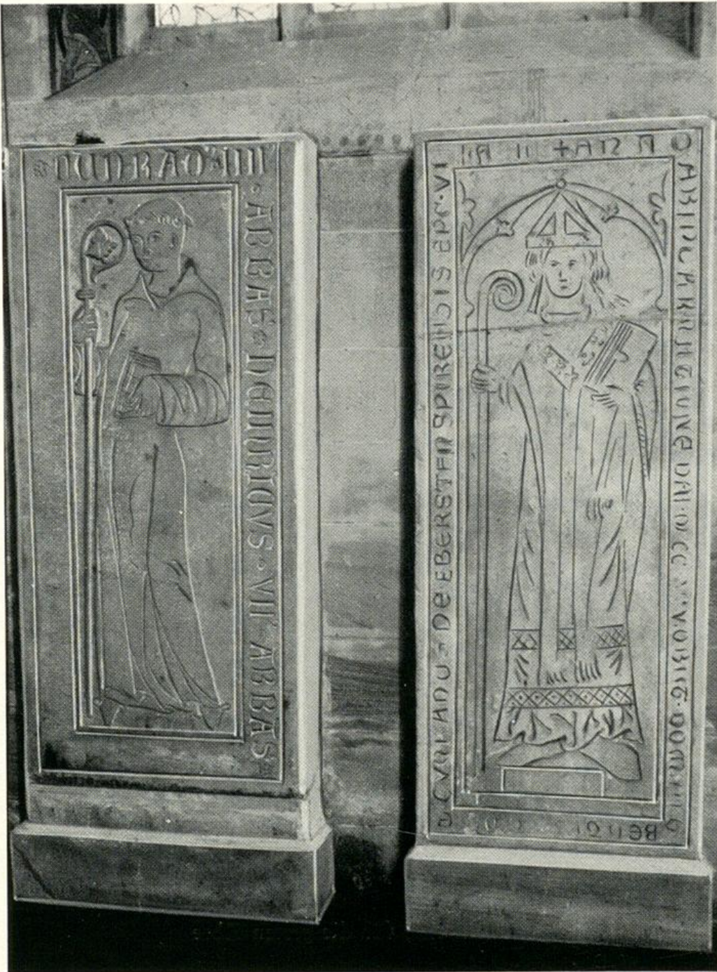
Rechts: Grabmal des Bischofs Konrad V. von Speyer