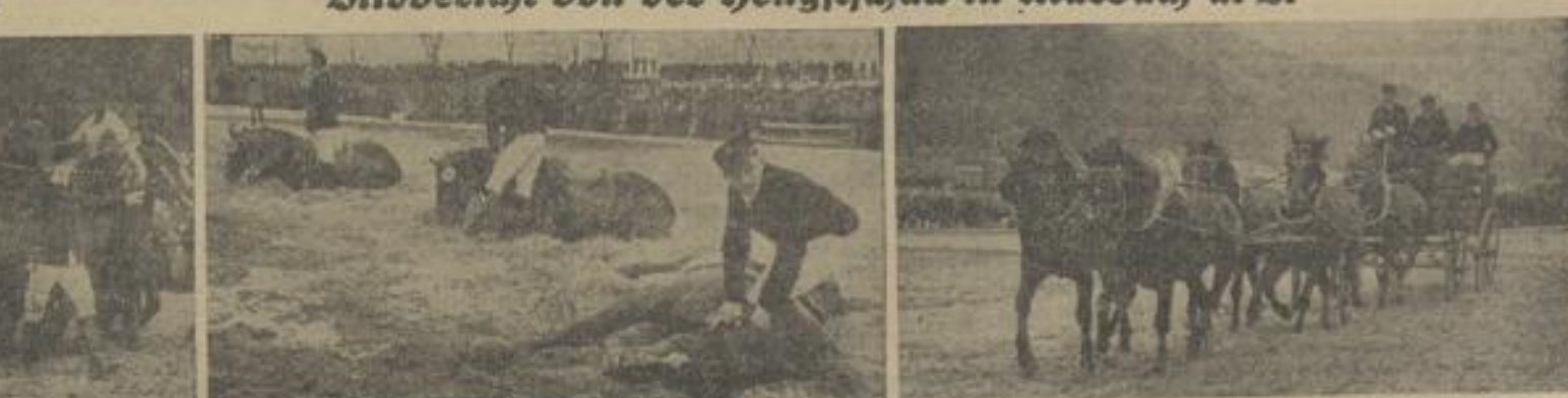
Oben links: Drei besonders gutergeratene Schimmel der Warmblutrasse unter dem Sattel. Unten von links nach rechts: Eine Pinzgauer Hengstkoppe (Kaltblutrasse) - Gevorsamkeit-Prüfung für dreijährige Hengstfohlen - Warmblutrasse vor dem Bock aus gefahren