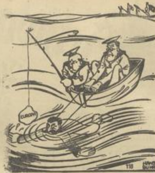
„Immer feste, Väterchen!“

Sind das nicht Worte, die die Zeiten überdauert haben, die auch heute wieder, wo unser Volk im entscheidenden Schicksals-kampfe steht, fränkischem Denken und Handeln entsprechen? So wie jene große Königin fest an den Sieg des Guten und des Gerechten glaubte und diesen Glauben mit jedem neuen Tag in die Tat umsetzte, indem sie zum Mittelpunkt wurde, um den sich Männer und Frauen in der Vorbereitung der Freiheitskriege scharten, so muß auch heute jede einzelne Frau eine Hochburg des zuverlässigen Glaubens und der Tatbereitschaft sein. Wie sagte doch der Führer in seiner Rede am 8. November: „Die Frauen müssen mit den Männern der Bewegung auch in schweren Tagen den Halt geben.“ In diesen schweren Tagen stehen wir nun ernst, doch in felsenfester Juchtheit, denn jede Frau weiß, daß alles neue Leben nur unter Schmerzen geboren wird. Wie die Parteigenossinnen dem Führer auch in den aussichts-losesten Tagen beistanden und die Kraft dazu hatten dank ihrem