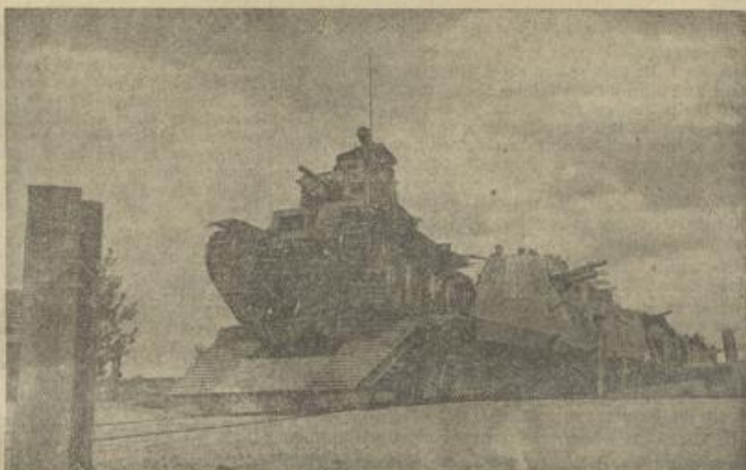
Ein Panzer wird ausgebootet . . .