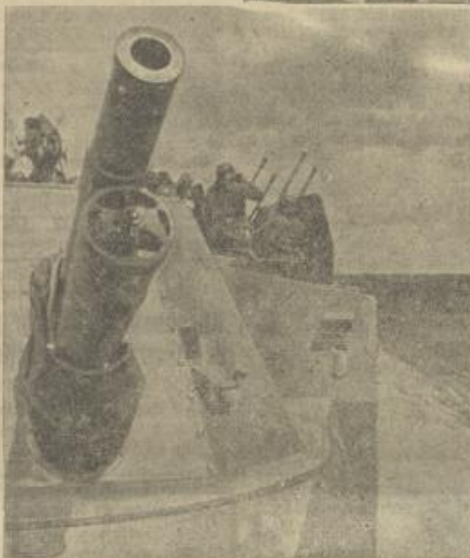
Ob der Gegner von oben oder von unten kommt — man erwartet ihn und ist vorbereitet

an Waffen und Gerät entspricht neuzeitlichen Anforderungen. Durch Funk hat jeder Zug Verbindung mit seinem Kommando. Ein eigener Panzertroop bewältigt den gesamten Funkbetrieb. Ein Panzerführer, der