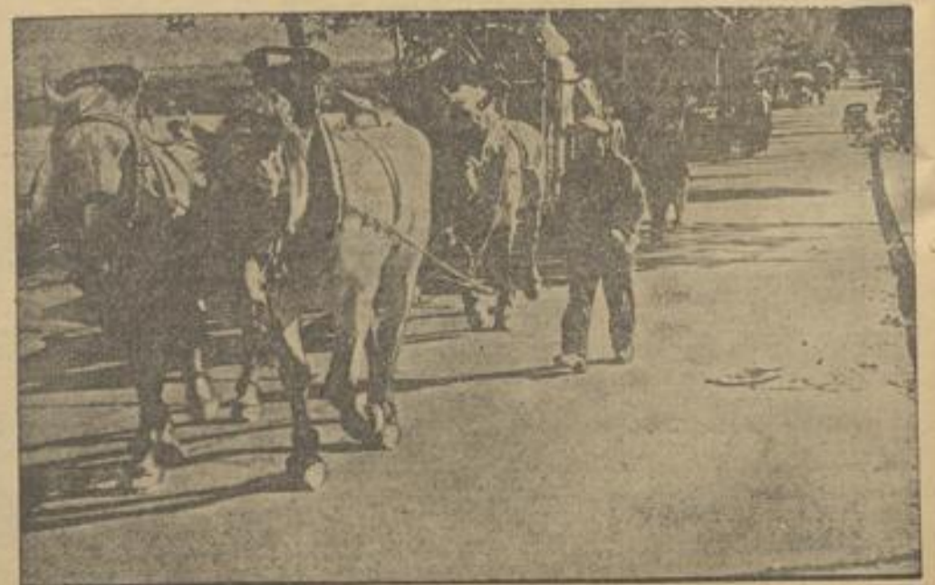
Heimkehrende Flüchtlinge im Hause von Courtenay. Viele Tage und Wochen waren die bedauernswerten Opfer ihrer plutokratischen Kriegstreiber oft unterwegs. Nun kehren sie wieder in ihre Heimatdörfer zurück, wo mit den deutschen Leuten wieder Ruhe und Ordnung eingezogen sind.