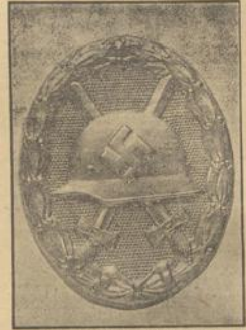
Das neue Verwundetenabzeichen Weltbild (M).