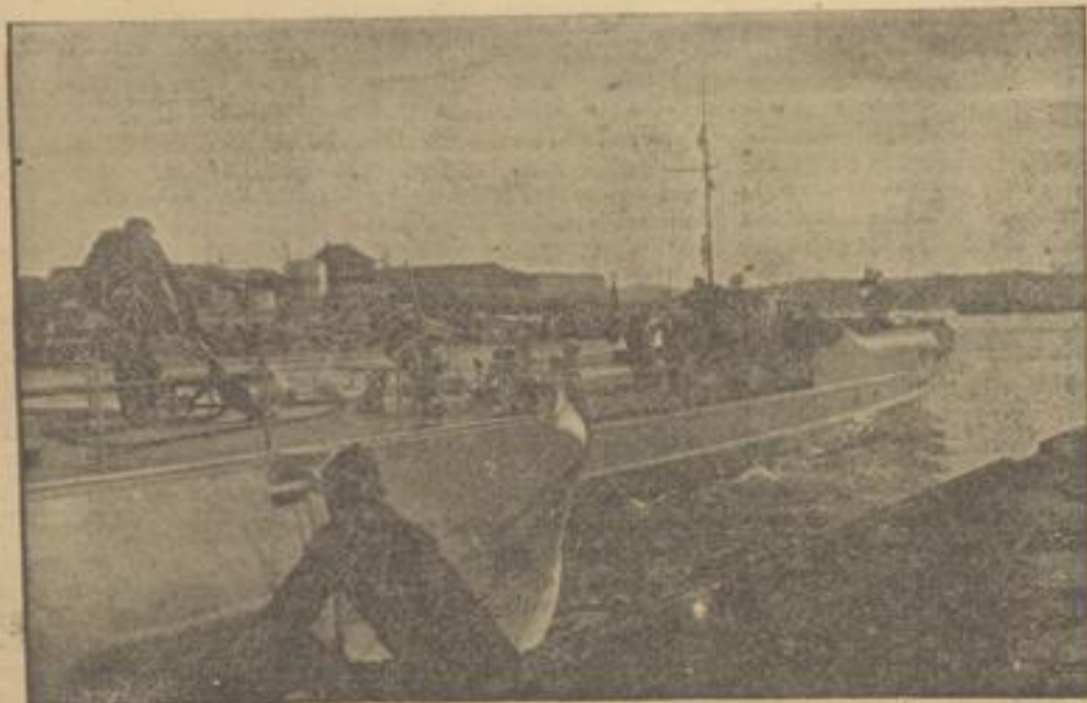
Deutsche Schnellboote laufen aus zur Fahrt gegen England