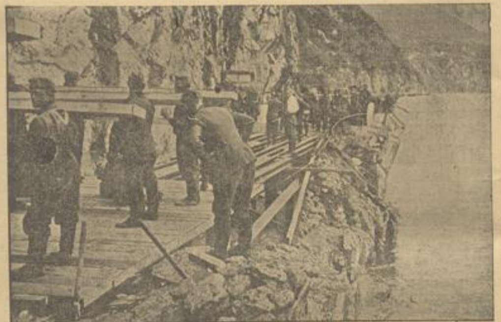
Pioniere stellen eine von den Franzosen gesprengte Straße bei Mir-lez-Bains wieder her.