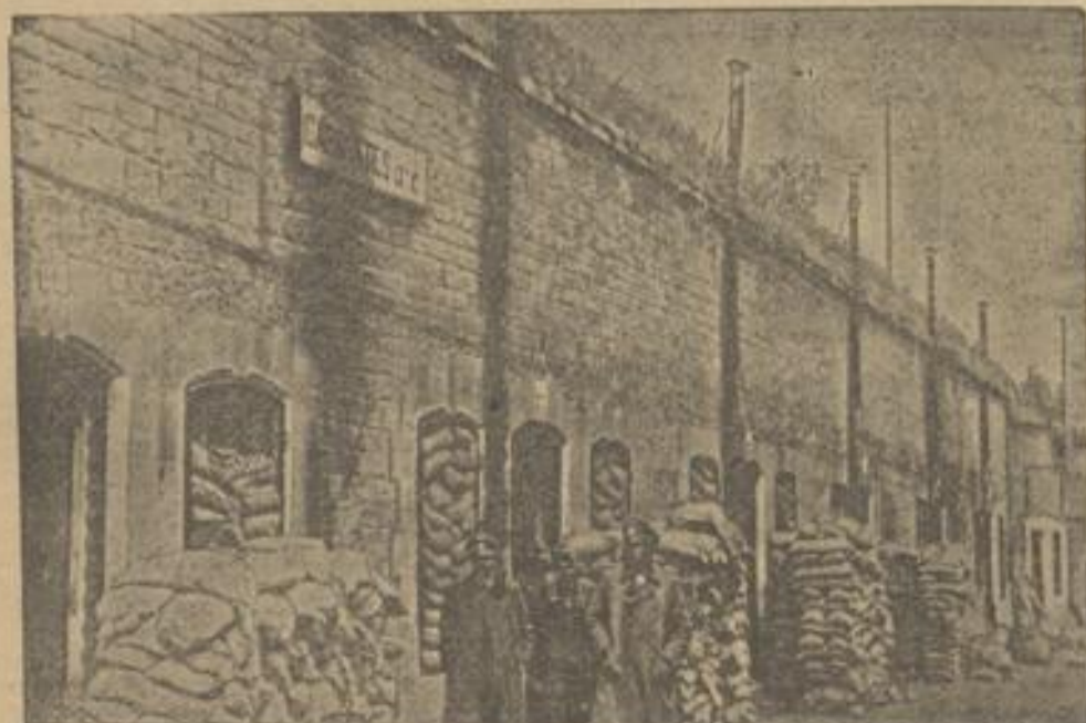
In den Kasematten der Zitadelle von Montmédy. General der Infanterie Busch besichtigt die Kasematten der Zitadelle von Montmédy.