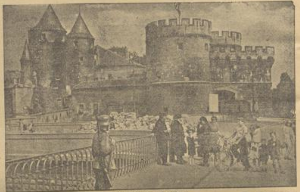
Wiedersehen mit Metz. Auf dem Deutschen Tor, einem der charakteristischsten Bauten der Stadt, weht die deutsche Flagge.