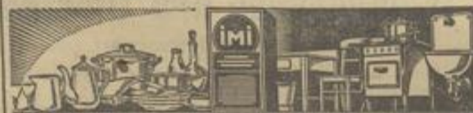
Alles Kücheninventar wird durch hell und klar!

Gerichtsvollzieherstelle des Amtsgerichts Neuenbürg.