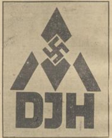
Das neue Kurzzeichen des Deutschen Jugendherbergswertes.

steht das Abschlußspiel Ottenhausen-Spyrlenhans auf dem Plan. Die Jugend führt folgende Spiele durch: Engelsbrand-Conweiler, Arnbad-Ottenhausen, Döbel-Rotenfol.