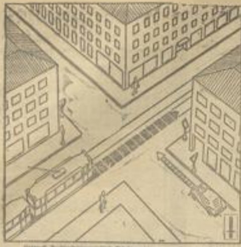
Stadtpläne der Kreisstädte...