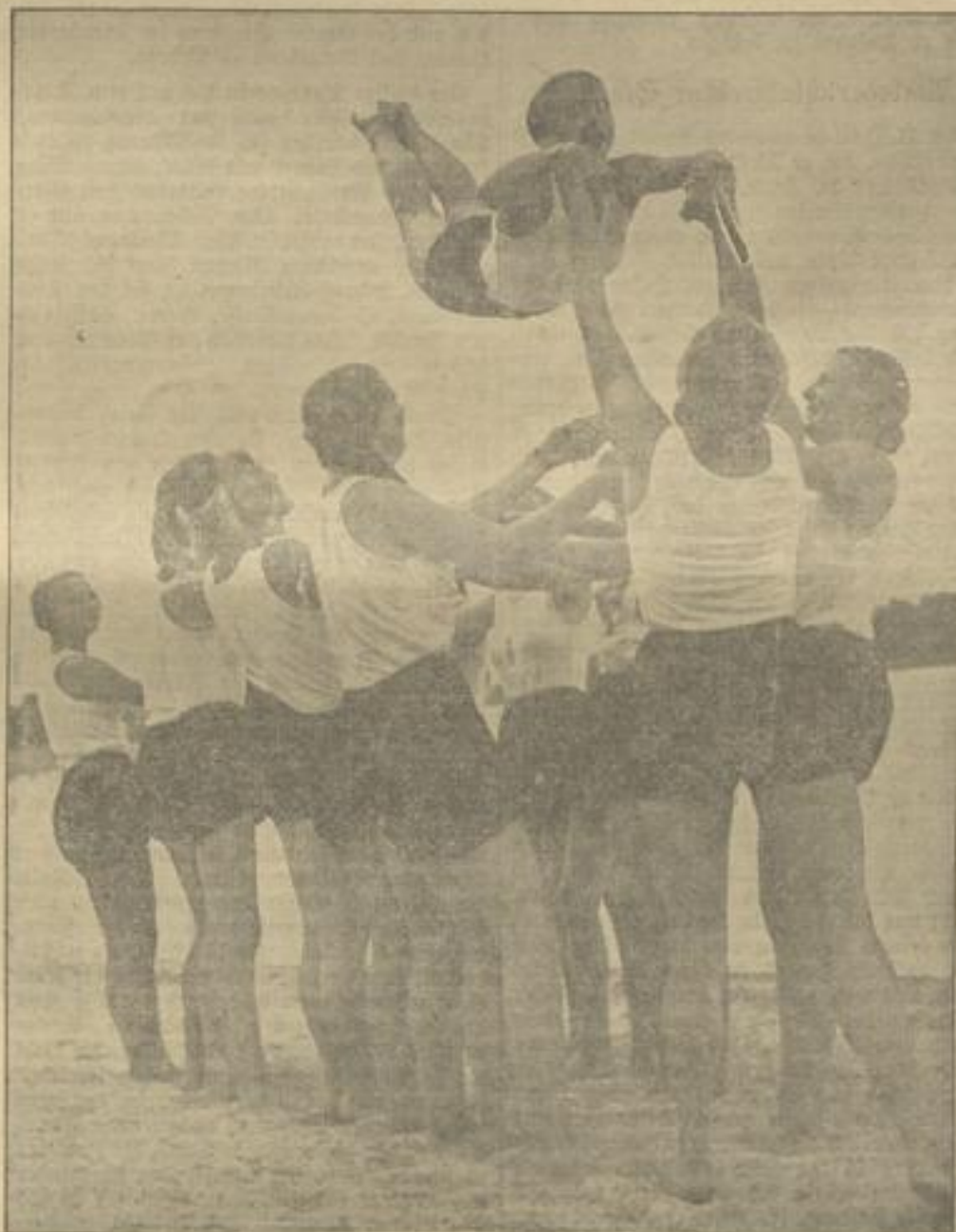
So froh sind B.D.M.-Mädels beim Sport

aus den Oberämtern Neuenbürg, Calw, Nagold, Freudenstadt, Horb, Sulz a. N. und Schramberg-Oberndorf kommen am nächsten Samstag und Sonntag nach Nagold, um ihren sportlichen Leistungswillen unter Beweis zu stellen. Wir schaffen nicht für uns, sondern legen den Grund für die Erziehung einer ganzen Nation!