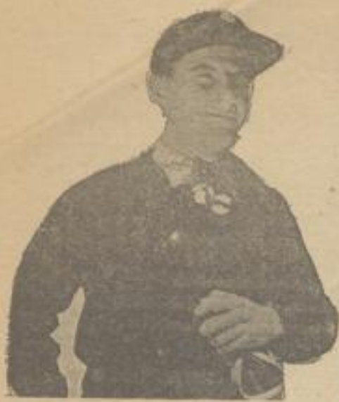
Dies ist die Mütze und der offizielle Pullover des Deutschen Schl.-Verbandes in Dunkelblau mit rundem Halsausschnitt. (Herstellung in Trockenwolle oder Schafwolle.)