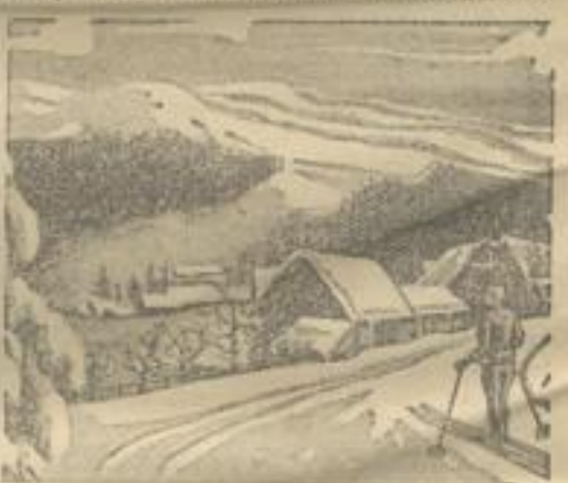
Ein schöner Schweg im mittelhessischen Bergwald

Die Schilabfahrten sind große Mode geworden, nicht nur im sportlichen, sondern auch im touristischen Sinne. Man mag das ein wenig bedauern, denn die Touristik (nicht der Sport!) kommt hierbei zu kurz. Die ideale Schitour umschließt Aufstieg und Abfahrt, möglichst in stetigem Wechsel. Vor den Monnen der Abfahrt soll