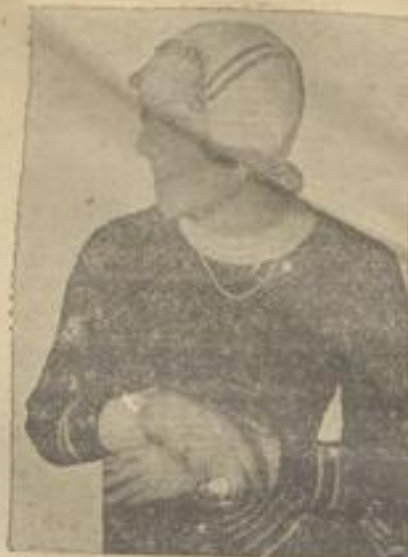
Sonja Henie, die norweg. Eislautweltmeisterin in einem dunkelblauen Pullover mit weißem Halsausschnitt und weißen Armstulpen aus Trockenwolle. Auch die weiße Strickmütze mit Doppelstreifen ist aus Trockenwolle gefertigt.