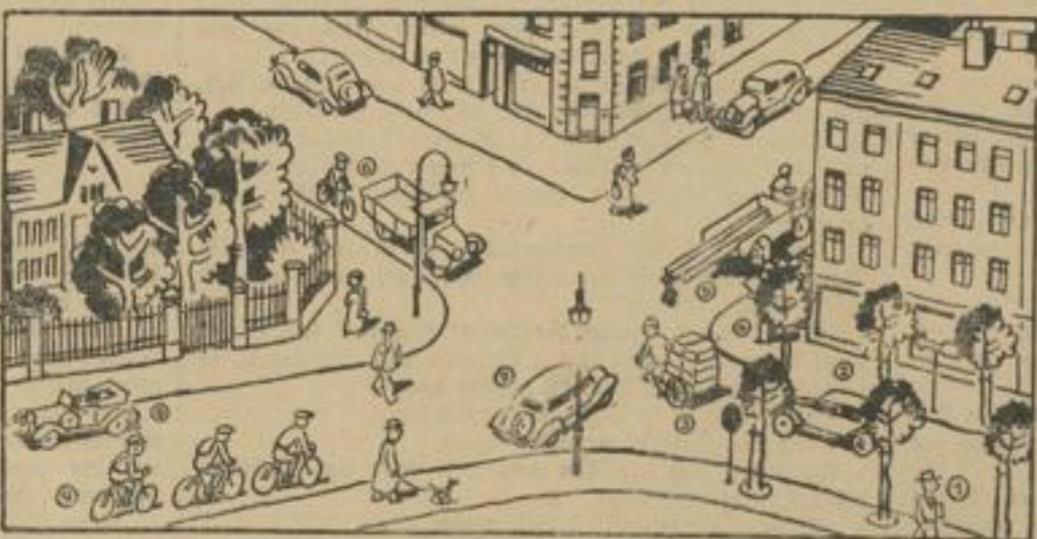
Hier findest du keine Verkehrsründer mehr