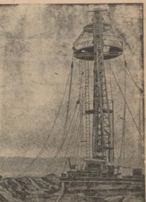
Rechts: Der neue Kalandarm im Weltflughafen Frankfurt a. M. Links: Luftschiff „Hindenburg“ in der großen neuen Halle.

und zwei Jahre später? Nun, statt des greifen Herrn, der damals mit der Welt im Hader lag, weil er wegen der Abherrung seiner Augen in der Ober-