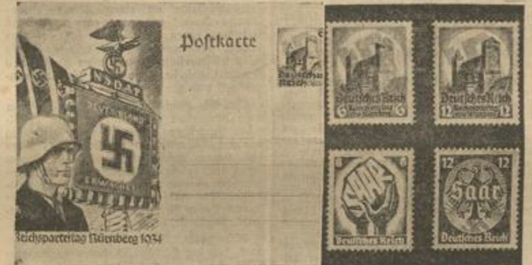
Neue Postwertzeichen zur Saarabstimmung und zum Reichsparteitag. Rechts: Die Reichspost gibt anlässlich des Reichsparteitages und der Saarabstimmung neue Postwertzeichen heraus, deren Entwürfe von dem Künstler Mjölner stammen. Oben: Die Briefmarke für den Reichsparteitag, die die Burg von Nürnberg zeigt. Unten: Die Marken zur Saarabstimmung mit der Aufschrift „Saar“. Auf dem Bild der Sechspfennigmarke halten zwei Hände ein Stück Saarerde, die Zwölfpennigmarke zeigt einen Adler. Links: eine Postkarte für den Reichsparteitag.

Wenn die Geburten- und Sterblichkeitsziffer die gleiche bleibt wie augenblicklich, wird in etwa 20 Jahren Totio mit einer Bevölkerung von 11 Millionen Menschen die größte Stadt der Welt sein. An zweiter Stelle wird Newyork stehen mit über 10 Millionen Menschen, an 3. Stelle endlich Schanghai, das eine Einwohnerzahl von 9 Millionen haben wird.