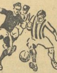
Der Fußball vor den Augen...

Neben einigen sehr netten Gedächtnisvorträgen hielt der (Fortsetzung siehe Seite 4.)