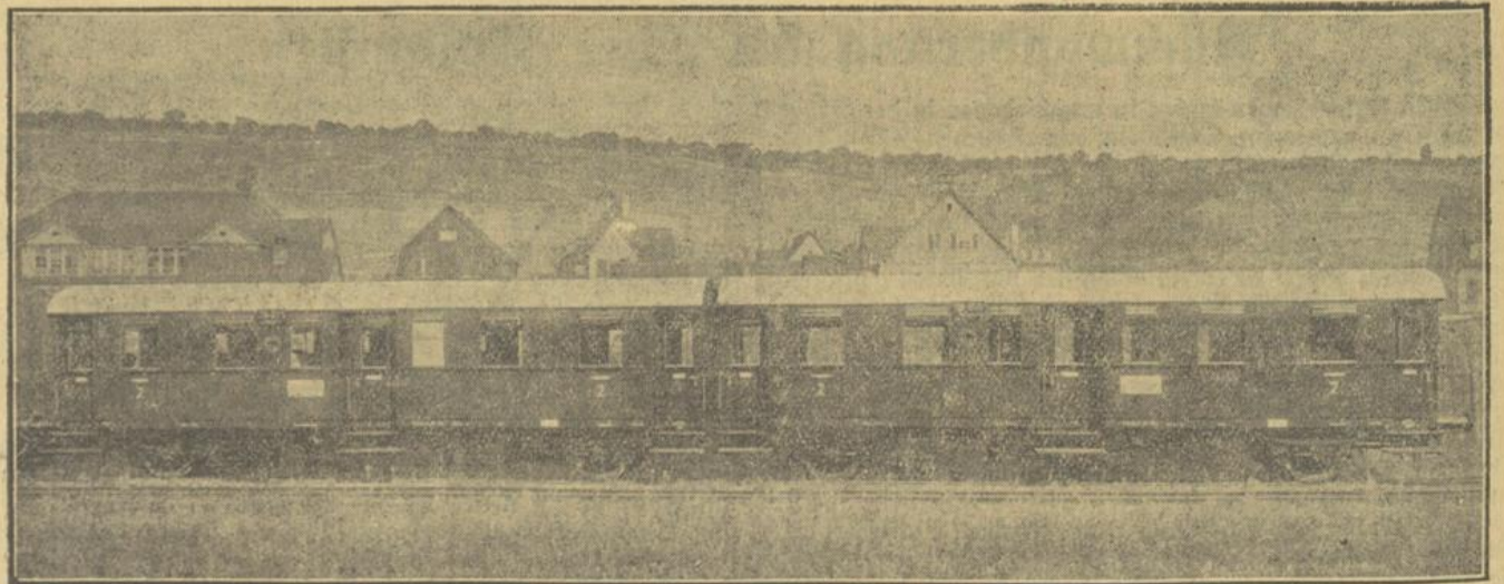
Die neuen Wagen der Reichsbahn

Die beiden Gegensätze des Lebens: Geld und Seele sind nicht glatt zu trennen, sondern enger ineinander verwurzelt, als man gewöhnlich annimmt. Darum, wenn jemand sich die Gewissenfrage vorlegt, „Was bin ich wert?“, so kann er sie sich gar nicht allein nach der seelischen oder geistigen Seite beantworten. Der geistreichste Mensch kann ein Tagedieb und Müßiggänger sein, der den Seinen le-