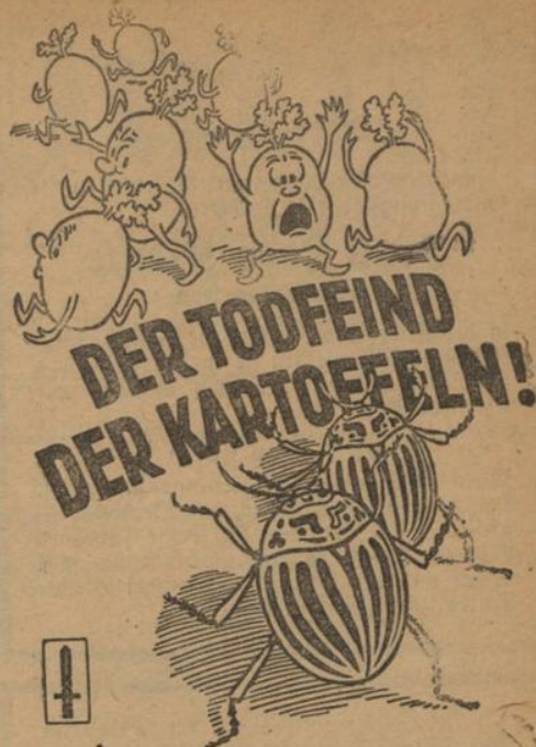
MELDE FUNDE DES KARTOFFELKÄFERS DER ZUSTÄNDIGEN POLIZEIBEHÖRDE! Herausgeber: Reichsarbeitsgemeinschaft Schadenverhütung.

Nagelmaschinen bringen aus einem Behälter die Nägel automatisch in der richtigen Stellung zum Arbeitsstück (beispielsweise einem Kistenrahmen). Mit Hilfe eines Druckstempels werden die Nägel gleichzeitig eingetrieben.