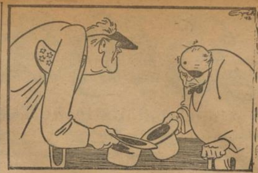
Die Begegnung in Washington „Haben Sie Tonnage?“ - „Haben Sie Siege?“ (Zeichnung: Erik.)

bringen es nämlich fertig, am 1. Juli, nachdem ihre stärkste Festung bereits gefallen war, mit frecher Stirn zu behaupten: „Unsere Kämpfer haben den Feind vor Sewastopol zum Stehen gebracht und ihn an manchen Stellen sogar zurückgedrängt.“ Am nächsten Tag wurde mit großem Stimmenaufwand in die Weltposaunt: „Der Feind berichtet von der angeblichen Befreiung Sewastopols. Das ist nicht wahr! Wenn aber Sewastopol in Zukunft befreit werden sollte, so bedeutet sein Sieg eine Niederlage und unsere angebliche Niederlage kann als Sieg betrachtet werden.“ Auf eine solche seltsame Logik kann man nur im Lager der Blotokraten und Bolschewiken verfallen, die immer wieder für der Welt die Meinung beibringen möchten, daß alle ihre Mühsüße und Niederlagen für sie immer nur Siege gewesen sind.