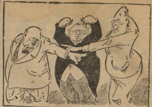
Prahlhänse unter sich

„Der englisch-amerikanische Kriegsrat ist fest entschlossen, eine zweite Front zu bilden!“ (Zeit-Scherz)