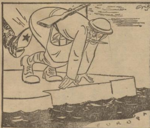
Offensiv! Offensiv! „Damned, laß die blöden Scherze - ich falle sonst noch hinein!“ (Bekanntung: Erit-Scherl)

Deutschland und Italien waren sich darüber klar, daß alle Vorbereitungen getroffen werden müßten, um die nationalen Wirtschaften für den Kriegsfall krisenfest zu machen, damit die bisher gefährlichste britische Waffe unschädlich wird. Der Führer hatte dieses Zukunftsproblem in den Programmen der Vierjahrespläne rücksichtslos eingeschaltet und selbst unter dem Deckmantel der plutekra-