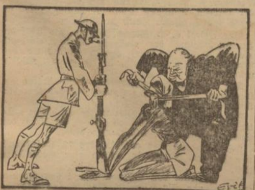
Churchills Empfehlung an Indien

Angesichts der Hoffnungen und Erwartungen, die Australien gerade auf die USA. setzt, wird der Druck der australischen Regierung auf Washington von Tag zu Tag stärker. Deshalb hat auch erst gestern australische Gesandten in Washington eine Demarche unternommen und erklärt, daß jetzt für die vereinigten Nationen die Zeit gekommen sei, um den Feind anzugreifen und Australien zu verteidigen.