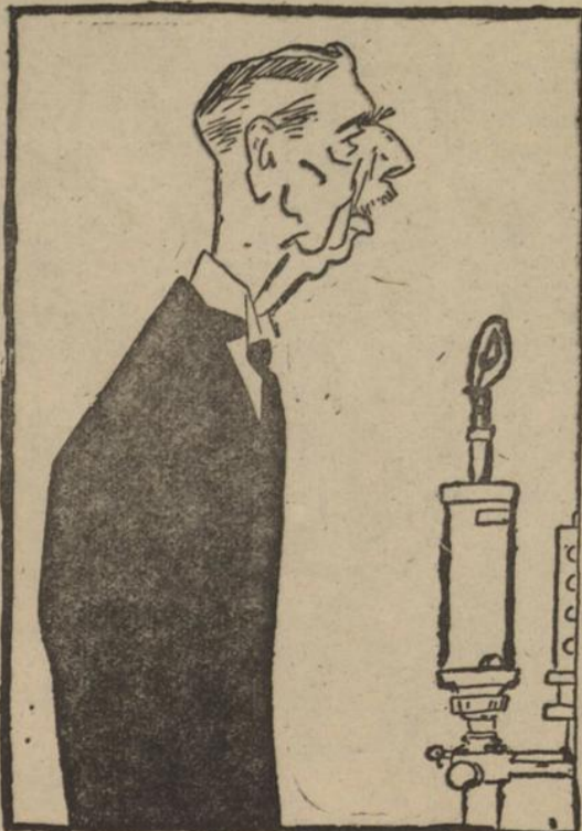
Chamberlain: „Ich habe nur den einen Wunsch, die Vernichtung Adolf Hitlers zu erleben“