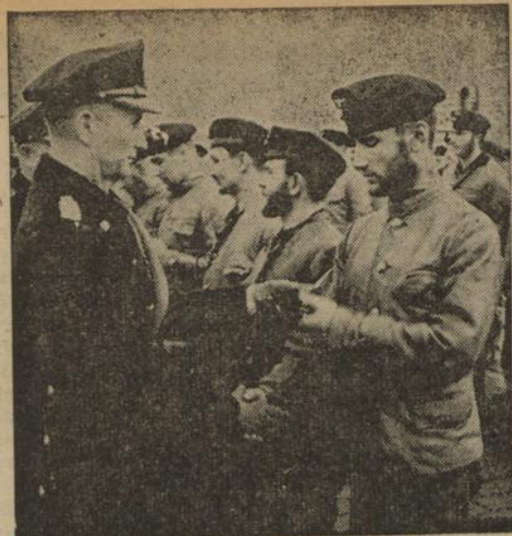
Ein U-Boot von Feindfahrt zurück. Der tapferen Besatzung wird hier durch Konteradmiral Dönitz das Eisenerne Kreuz übergeben.