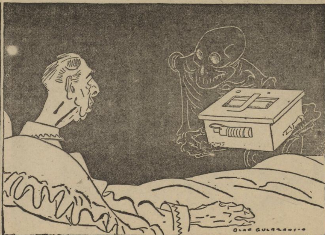
„Die Höllenmaschine ist zu spät losgegangen. Du wirst es nie erleben!“ (Zeichnung: Gulbranfon, „Angst“)