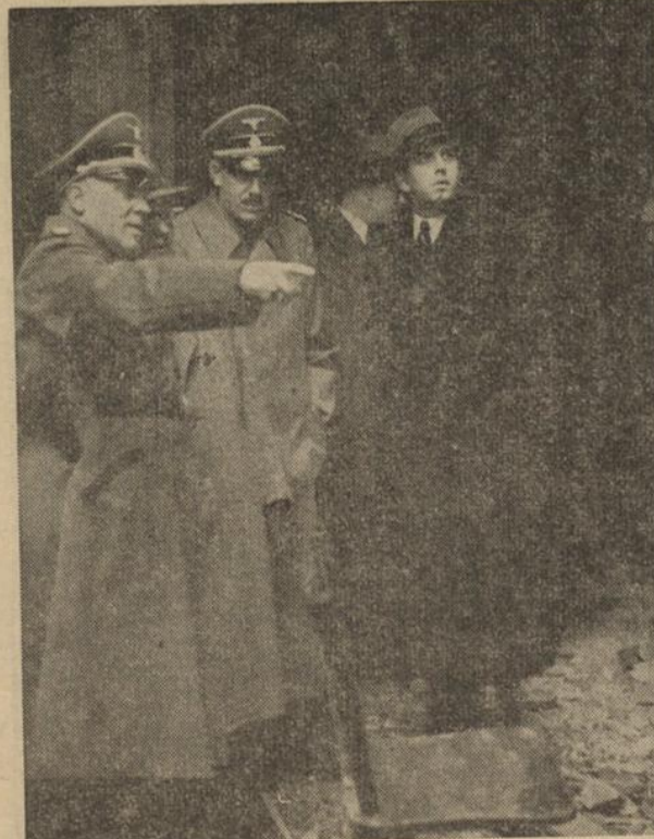
Zwei neue Bilder aus dem Bürgerbräukeller in München, die die verheerenden Verwüstungen des heimtückischen Anschlages auf den Führer veranschaulichen. — Die Untersuchungskommission bei der Arbeit.

Inzwischen verlaufen die Operationen nach dem japanischen Heeresbericht glatt. Die japanischen Truppen drangen, ohne nennenswerten Widerstand zu finden, 50 Kilometer in nördlicher Richtung landeinwärts vor. Der Hafenort Pakhoi wurde nach ausländischen Meldungen am Donnerstagmittag ohne Kampf besetzt.