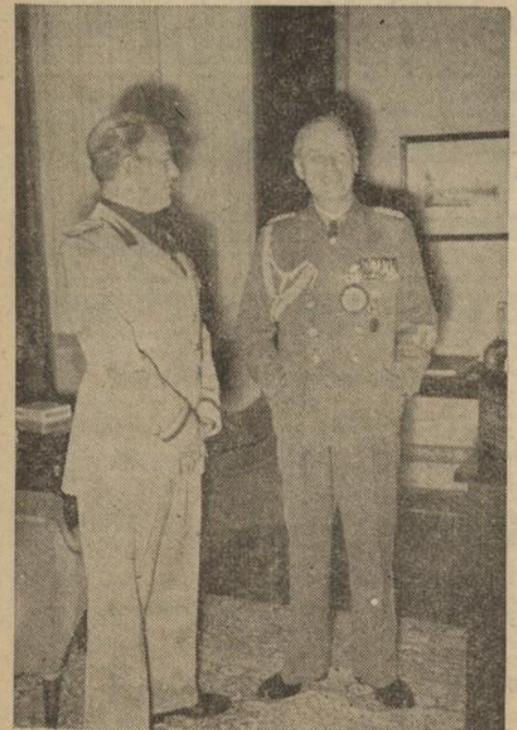
Außenminister Graf Ciano beim Reichsaussenminister.