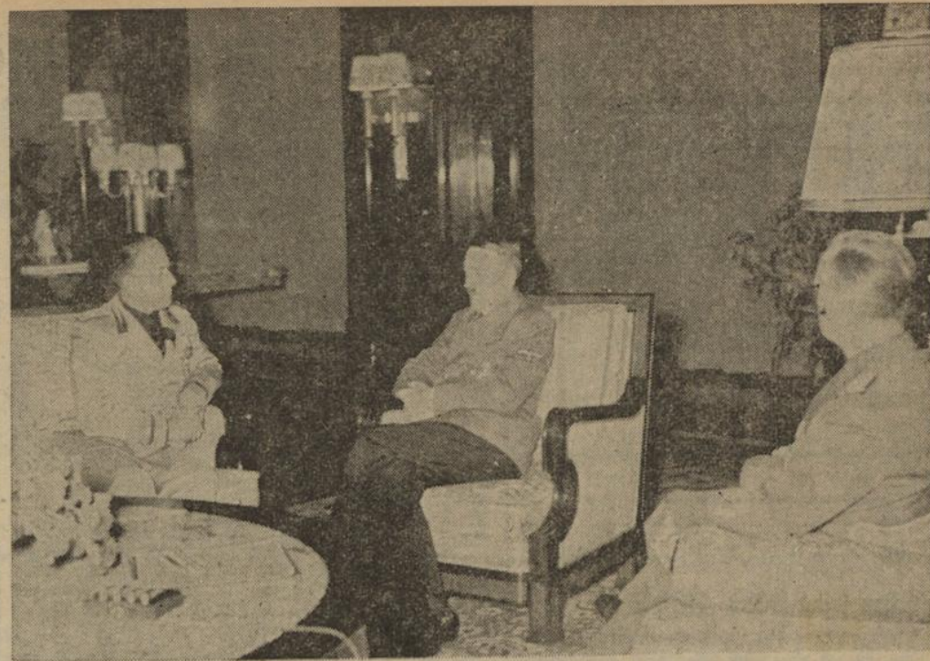
Der italienische Außenminister und Schwiegersohn Mussolinis, Graf Ciano, wurde am Sonntagabend vom Führer in der Neuen Reichskanzlei in Gegenwart des Reichsministers des Auswärtigen von Ribbentrop zu einer mehrstündigen Aussprache empfangen. Nach dem erfolgreichen Abschluß seines Berliner Besuchs trat Außenminister Graf Ciano am Montagmorgens die Rückreise nach Rom an. (Presse-Staffmann)

Am gestrigen Geburtstage Hindenburgs legte der NS-Reichskriegsverband am Sarkophag des Generalfeldmarschalls im Lannenbergdenkmal, an der Hindenburg-Wüste im Berliner Zeughaus und am Hindenburg-Denkmal auf dem Ruffhäuser Kränze nieder.