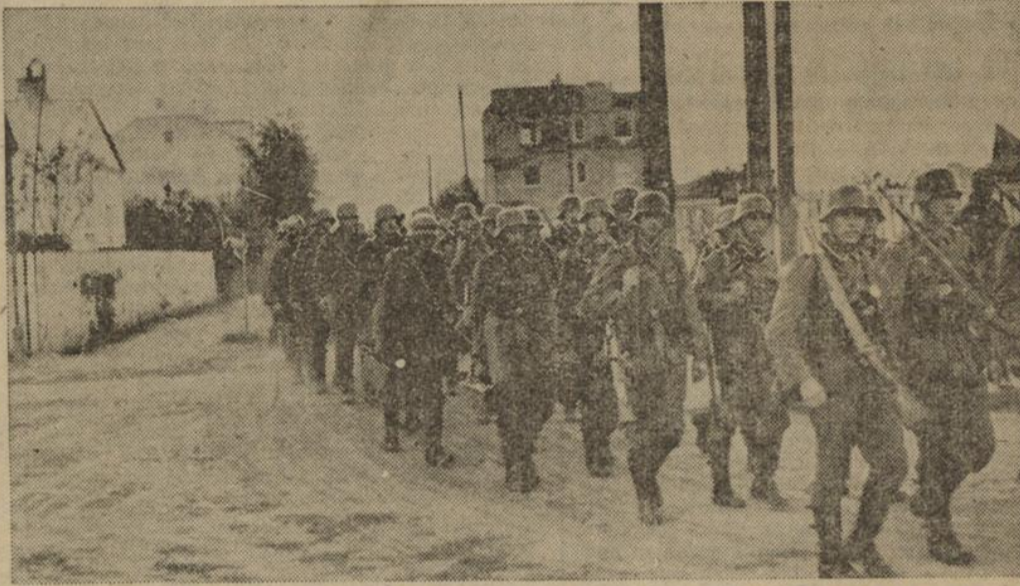
Die ersten deutschen Truppen ziehen in Warschau ein: Unser Bild zeigt eine Abteilung deutscher Infanteristen in einer Vorstadt Warschaus.