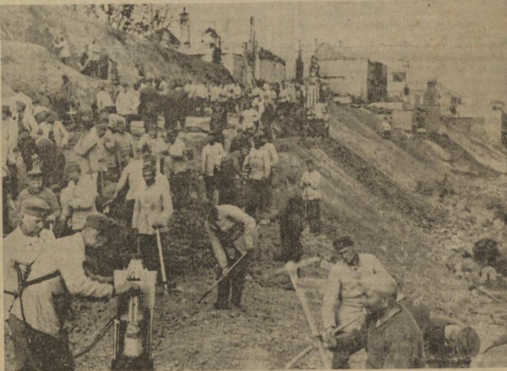
Aufbauarbeit in Polen: Pioniere bei Planierungsarbeiten in Polen. Nachdem nunmehr die Kampfhandlungen in Polen ihren Abschluß gefunden haben, beginnt sofort in allen von den Zerstörungen des Krieges heimgesuchten Gebieten des Landes der Wiederaufbau.