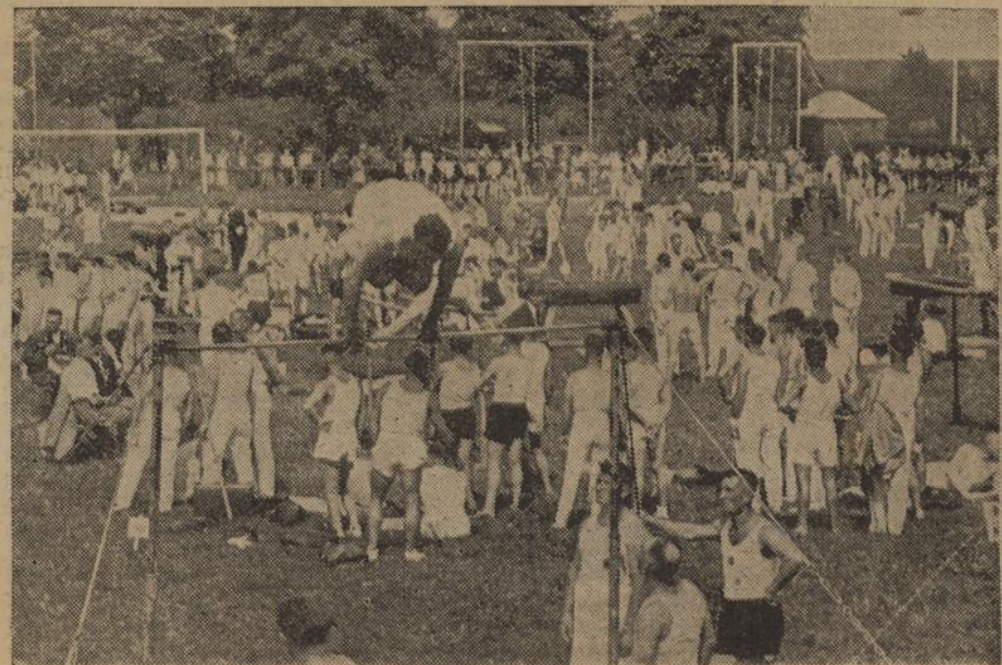
Über 1500 schwäbische Turner und Turnerinnen — eine gewaltige Zahl — im edlen Wetstreit beim zweiten Gaufest des NSRL in Ludwigsburg.

Der erstmals zur Durchführung kommende Fußball-Dreikampf — aus vorchriftsmäßigem Einwurf, Ballführen durch vier Tore und 100-Meter-Lauf bestehend — brachte einige Überraschungen. Zum ersten war die ganze Sache keineswegs so leicht, wie sich das manche vorgefellt hatten und zum zweiten kam hier einmal der Typ von Spieler zur Geltung, der nicht nur einen Bombenschlag besitzt, sondern auch schnell und technisch gut durchgebildet ist. Die 100 Meter bestietelsweise, in Fußballstiefeln auf Rasenboden gelaufen, waren keine ganz einfache Sache. Dabei war eine elektrische Zeitnahme vorhanden, die den meisten fremd, aber von allen begeistert begrüßt wurde. Beim Ballwurf kam ein heiser Gegenwind dazu, der auf die Weiten drückte. Die besten Wërre lagen knapp über der 20-Meter-Grenze, wobei mit 23 Meter der beste Wurf gemessen wurde. Am schwierigsten war jedoch ohne Zweifel das Ballführen. Die in knappem Abstand ausgetretenen Tore mußten ordnungsgemäß vor und rückwärts paßiert werden und dabei war die Zeit entscheidend, die der einzelne benötigte. Mit wildem Drauflosstürmen war hier gar nichts zu erben, ja die bedächtig „durchschleichenden“ Techniker kamen viel schneller ans Ziel.