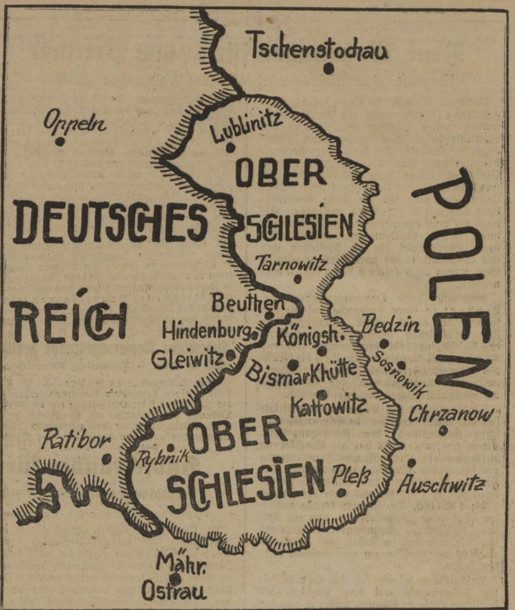
Die oberschlesischen Gebiete, die Polen Deutschland widerrechtlich geraubt hat

Diese beiden Nachrichten bilden jedoch nur die Ueberleitung zu dem großen Schläge, zu dem Kor-