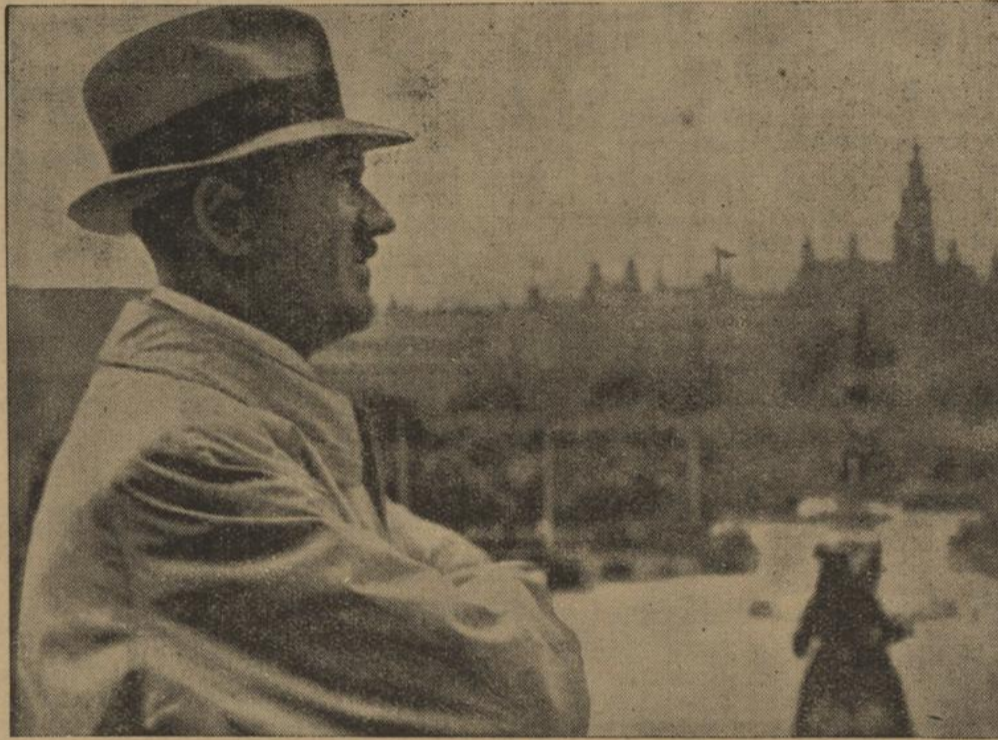
Der Führer in der Wiener Hofburg. In Begleitung von Reichsminister Dr. Seyß-Inquart und Gauleiter Bürckel besichtigte der Führer eingehend die Wiener Hofburg. Im Hintergrund erkennt man das Wiener Rathaus.

Köln, 14. Juni. Auf der zum Heilighauser Berg in den Ort führenden abschüssigen Straße kippte ein Traktor mit zwei Anhängern, die mit schweren Baumstämmen beladen waren in einer Kurve um. Dabei wurden von den Baumstämmen vier Personen getroffen, von denen zwei auf der Stelle getötet wurden, die dritte starb kurz nach dem Unfall, während eine vierte nach wenigen Stunden im Krankenhaus verschied.