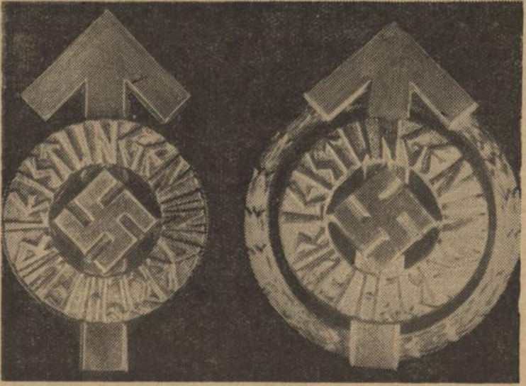
Links: Das HJ.-Leistungsabzeichen, Rechts: Das Goldene HJ.-Führer-Sportabzeichen.

HJ.-Leistungsabzeichen und vor-militärische Ausbildung