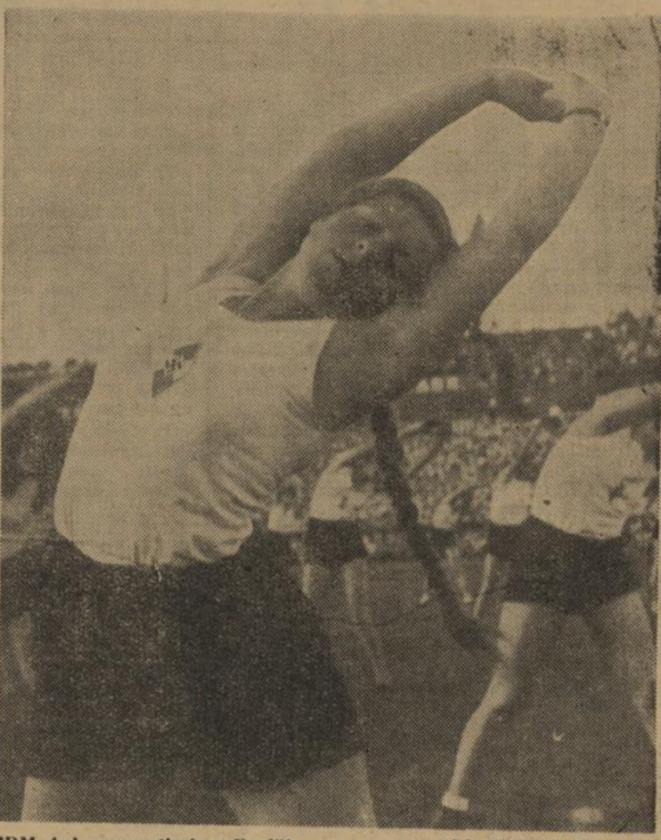
BDM. bei gymnastischen Vorführungen