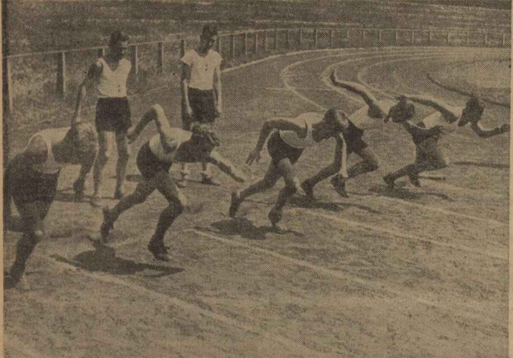
Hitler-Jungen starten zum 100-Meter-Lauf

Die besten Einzelkämpfer werden dann beim Bannsporttreffen ihre Gefolgschaften und Fähnleins vertreten. Die beste Mannschaft des Bannes und Jungbannes wiederum vertritt den Bann bzw. Jungbann bei den Kampfspielen der HJ. 1939. Die beste Mannschaft des Gebietes Württemberg der HJ. und des D.F. kämpfen bei den Kampfspielen der HJ. in Nürnberg um den Reichssieg. So legt also schon der Reichssportwettkampf am 3. und 4. Juni 1939 außer den sich daran anschließenden Sportwettkämpfen den Grund zum Besuch des Reichsparteitages. Das Jungvolk und die Jungmädels führen ihre Kämpfe am Samstag, dem 3. Juni 1939, die HJ. und der BDM. am Sonntag, dem 4. Juni 1939 durch. Am Sonntagnachmittag werden dann die verschiedenen Einheiten ihre Sportfeste veranstalten.