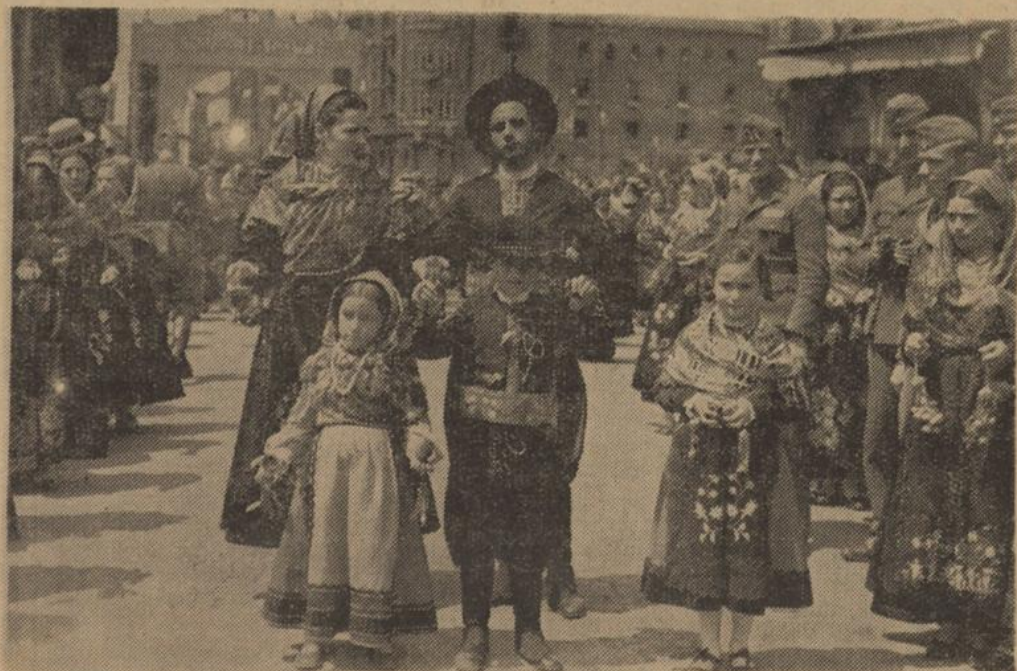
Eine Traktengruppe beim Volksfest in Leon, das zu Ehren der deutschen Freiwilligen veranstaltet wurde.