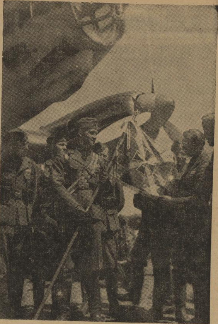
Das Feldzeichen der deutschen Freiwilligen, das General Franco der „Legion Condor“ verliehen hatte.

In raschem Siegeszug geht die Befreiung Spaniens vor sich. Im Januar fallen Tarragona und Barcelona; Anfang Februar 1939 werden die Pyrenäen erreicht. Die roten Streitkräfte in Katalonien sind zer schlagen und der Endkampf um Zentralspanien beginnt. Im Becken von Madrid werden jetzt die besten und kampferprobtesten Korps eingesetzt. Inzwischen wird in einem überraschenden Vorstoß Toledo genommen und somit Madrid noch stärker umklammert und schon am 29. 3. 1939 melden die Fernaufklärer der „Legion Condor“: „Weiße und nationale Flaggen über dem ganzen bisherigen Rotspanien.“ Mit Recht kann das deutsche Volk auf diese gewaltigen und unvergeßlichen Leistungen, die hier in kurzem Abriß aufgezeigt wurden, stolz sein. Sie sind nicht zuletzt auch die Bürgschaft der herzlichen Freundschaft, die in Zukunft die deutsche und die spanische Nation Seite an Seite wie in den Tagen des Kampfes marschieren läßt.