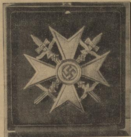
Zur Ordensverleihung an unsere Spanienfreiwilligen in Hamburg am 31. Mai

Hierzu ist zu bemerken, daß angesichts der zweifelhaften Rolle, welche die Liga bisher in der Danziger Frage an den Tag gelegt hat, von Danzig jede Einmischung von Genf in die schwebenden Fragen als nicht wünschenswert.