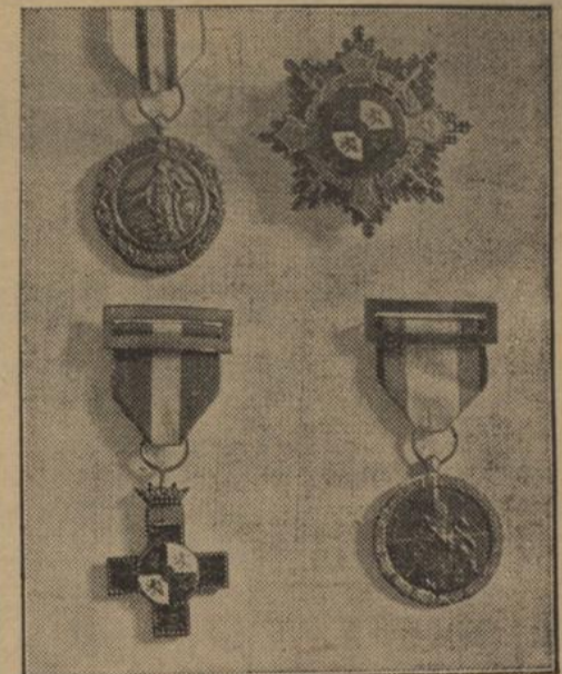
Die spanischen Auszeichnungen für die deutschen Freiwilligen

In Venedig tobten W i l d s t i l l e einen Bauer und eine Frau. Die großen Flüsse der Po-Ebene führen Hochwasser. In