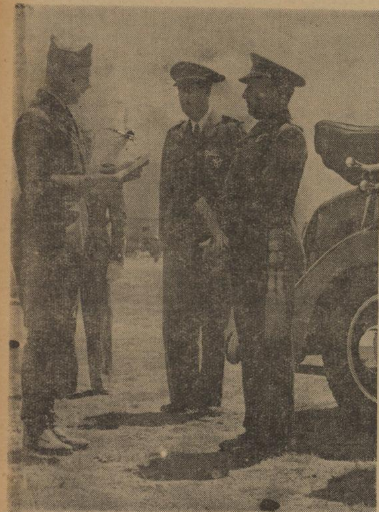
Der Kommandeur der deutschen Spanienfreiwilligen, General von Richtofen, bei der Verkündung der Spende der deutschen Freiwilligen — eine Million Peseten — die für die Angehörigen der Gefallenen der spanischen Luftwaffe bestimmt ist. Neben General Franco der Befehlshaber der Luftwaffe, General Kindelan.

kehrenden Helden bereiten werden. Der Kampf ist zu Ende. Franco hat die Aufbauarbeit in seinem Lande in großem Umfang begonnen. Das spanische Volk hat sich von den deutschen Freiwilligen in Madrid und Leon jubelnd verabschiedet — das spanische Ringen ist damit schon Geschichte.