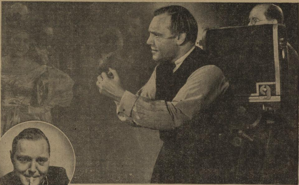
„Ich darf keine Nerven haben — sonst ist's aus!“

Hier findet der Wunsch des modernen Rauchers Erfüllung: Reiches Aroma und natürlich gewachsene Leichtigkeit in einer Zigarette vereint. Darum greifen täglich mehr und mehr genießerische und überlegende Raucher zur „Astra“. Besondere Kenntnis der Mischkunst und der Provenienzen ist das ganze Geheimnis. Aber nur im Hause Kyriazi lebt sie nun, vom Großvater auf den Enkel vererbt, in dritter Geschlechterfolge als die erste und vornehmste Pflicht des Inhabers. Rauchen Sie „Astra“ eine Woche lang. Dann werden Sie wissen, was es heißt, aromatisch und doch leicht zu rauchen. Kaufen Sie noch heute eine Schachtel „Astra“!