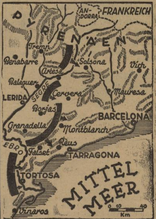
Es geht auf Tarragona zu. Die Nationaltruppen sind jetzt auf die zweite große Widerstandslinie der Bolschewisten gestossen und stehen nach ihrer teilweisen Durchbrechung vor Tarragona. Die gesamte nationalspanische Front ist jetzt ungefähr 170 km lang. (Kartendienst, S.-M.)

Im Süden von Espluga de Francoli wurde das Kloster Poblet besetzt. Die Nationalen waren dort so rasch vorgeedrungen, daß die Roten ihre Absicht, die Kunstschätze des Klosters zu plündern, nicht mehr verwirklichen konnten. Der Feind verlor über 1000 Gefangene und zahlreiche Tote. Unter der großen Beute befindet sich auch ein Waffenlager.