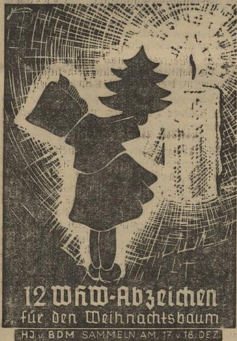
12 WW-Abzeichen für den Weihnachtsbaum

Interessantes aus der Straffung des Amtsgerichts Calw Weil sie mutwilligerweise ein Faßerfeld im Oberkollwangen zertreten hatten, mußten fünf jugendliche Burschen vom Jugendgericht in Strafe genommen werden.