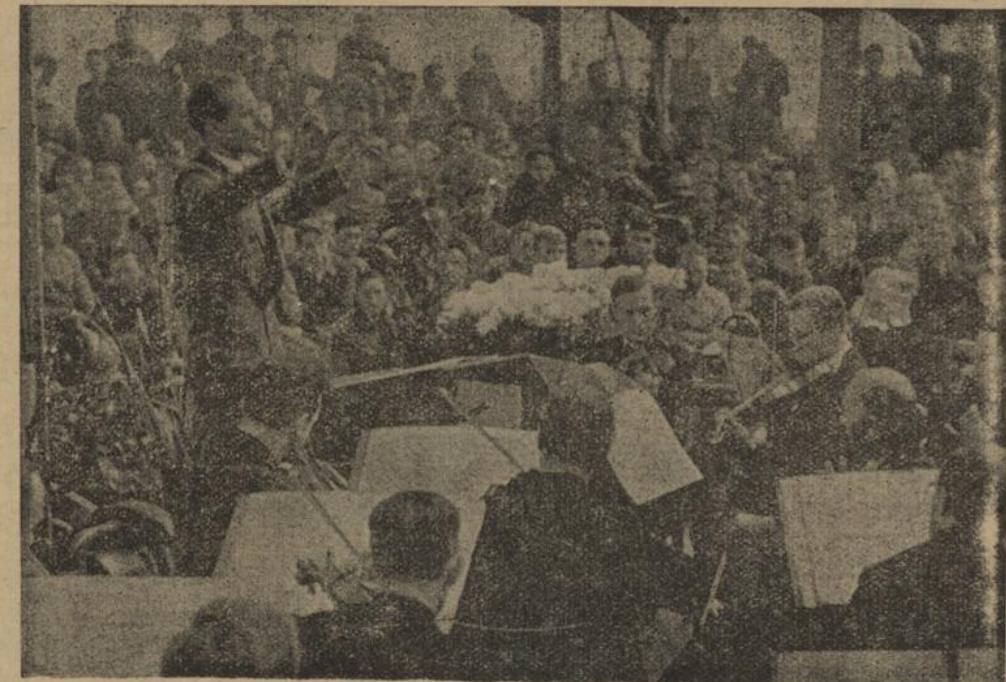
Das Landestheaterorchester (Leitung Gerhard Maab) gab in dem Musterbetrieb von Alling-Kessler in Wasseralfingen ein Werkkonzert, das von den mehr als tausend Werksangehörigen mit stärkstem Beifall aufgenommen wurde.