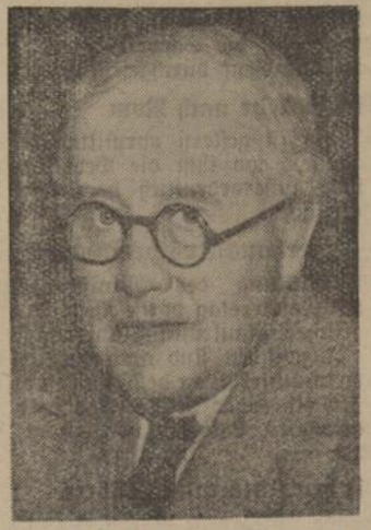
Der neue englische Luftfahrtminister Sir Kingsley Wood (Rechtsbild, Sander-R.)

Was in Südamerika zur Zeit vor sich geht, läßt sich sehr kurz auf folgende Formel bringen: Ueberall befindet man sich auf dem Scheitelpunkt. Ob aus einer außenhandelspolitischen Zwangslage oder aus dem wirtschaftspolitischen Streben nach nationaler Selbständigkeit, lassen wir in diesem Zusammenhang offen. Fest steht eins: Auch in Südamerika bemüht man sich, die Umrisse einer neuen in anderen Staaten bereits bewährten Ordnung zu erkennen und zu verstehen. Man hat nicht nur begriffen, daß die