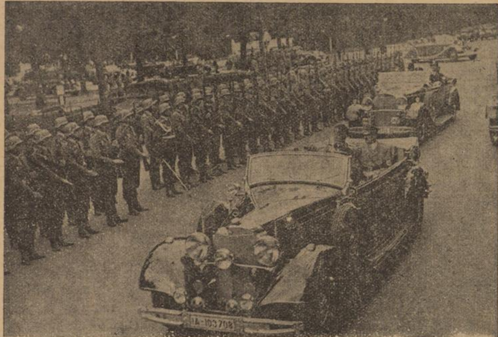
Der Duce und der Führer begeben sich im Wagen zur Abnahme der Parade

In diesem Zusammenhang erscheint die Tatsache erwähnenswert, daß vor kurzer Zeit in Italien eine neue Sammlung deutscher Dichtung erschien, „Nuova Anthologia Tebesca“, in der Klopstock einen hervorragenden Platz einnimmt. Und das nicht nur in der Auswahl der Gedichte, sondern auch im einführenden Text. Wenn sich nun auch Mussolini durch sein Geschenk von neuem zu Klopstock bekennt, dann unterstreicht diese Tatsache nicht zuletzt die Arbeit der Klopstock-Gesellschaft, die dem Namen des Dichters in den letzten Jahren wieder die verdiente Geltung verschaffte, und die weiter daran arbeiten wird, dieses gewiß nicht leicht zugängliche Werk dem deutschen Menschen näherzubringen.