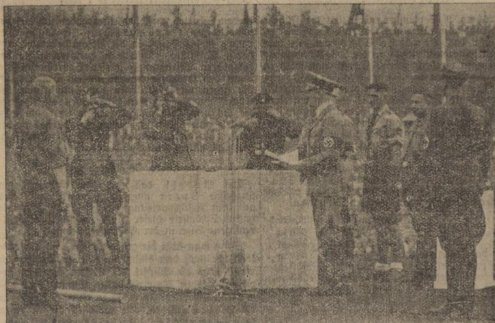
Mit drei Hammerschlägen legte der Führer den Grundstein zur größten Sportstätte der Welt.

Salamanca, 9. Sept. In Äthiopien haben die Anarchisten die Macht an sich gerissen und die Provinz für „unabhängig“ erklärt. In Gijon herrscht infolge ihrer Willkürherrschaft Panik. Die Häuser und Wohnungen der wohlhabenden Familien sind sämtlich geplündert worden. Hohe sowjetrussische Funktionäre wurden ermordet.