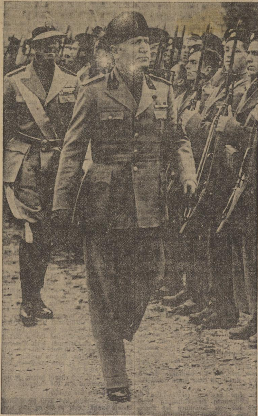
Benito Mussolini und seine faschistische Jugend

endet werden können, dann ist es geradezu wahnhaftig zu glauben, daß diese Völker leichtfertig einen Krieg suchen könnten. Mussolini und Adolf Hitler verständigten sich, weil die Interessen beider Völker einen langen und dauerhaften Frieden erfordern. Beide Staatsmänner erstreben das Glück ihrer Völker, das nicht vom blauen Himmel heruntersinkt, sondern das erarbeitet werden muß. Es ist selbstverständlich, daß beide Völker diesen Aufstieg nicht leichtfertig verspielen wollen, darum schämen Mussolini und der Führer, jeder seinem Volke eine starke Wehr. Es dürfte den Reden nicht leicht sein, das friedliche Aufbaue der beiden Nationen zu führen. Wenn Italien auch stark sein mag, wenn auch das Dritte Reich eine wehrhafte Großmacht sein mag, die sich ihrer Kraft bewußt ist, so liegt doch in dem Einverständnis beider Nationen, in der Achse Rom-Berlin die stärkste Garantie für einen langen und dauerhaften europäischen Frieden. Wenn darum Mussolini und Adolf Hitler in den kommenden Wochen zusammentreffen, so kann ihre Begegnung nur die eine Absicht haben, diesen Frieden durch persönliche Aussprache noch zu festigen und zu stärken. Die beiden Völker und schließlich Europa werden ihnen das danken.