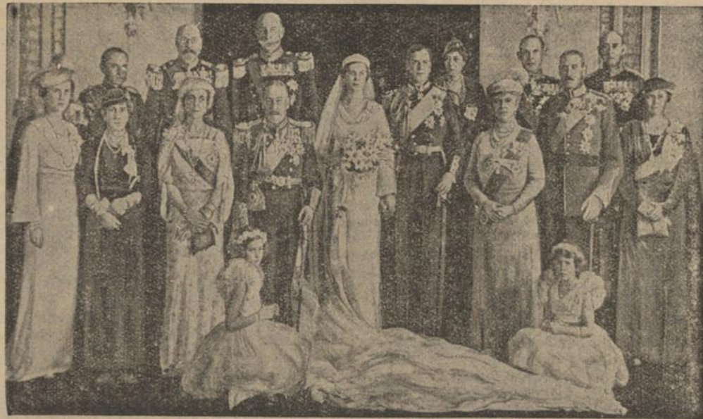
Das offizielle Bild der Londoner Hochzeit

Wir wollen keinen Krieg, aber wir wollen unsere Ehre, und über die diskutieren wir mit niemandem in der Welt, die steht fest, denn sie ist die Grundlage für den Aufbau der gesamten Nation. Nur wer ein scharfes Schwert an seiner Seite hat, hat Ruhe, hat Frieden. Es ist nicht so, als ob das zum Kriege reize. Nein, wenn einer wehrlos ist, dann mag das Anreiz sein, ihn anzugreifen. Wenn er sich aber zu wehren vermag, dann wird der Friede auch bei ihm gesichert sein und damit zugleich der Friede in der ganzen Welt.