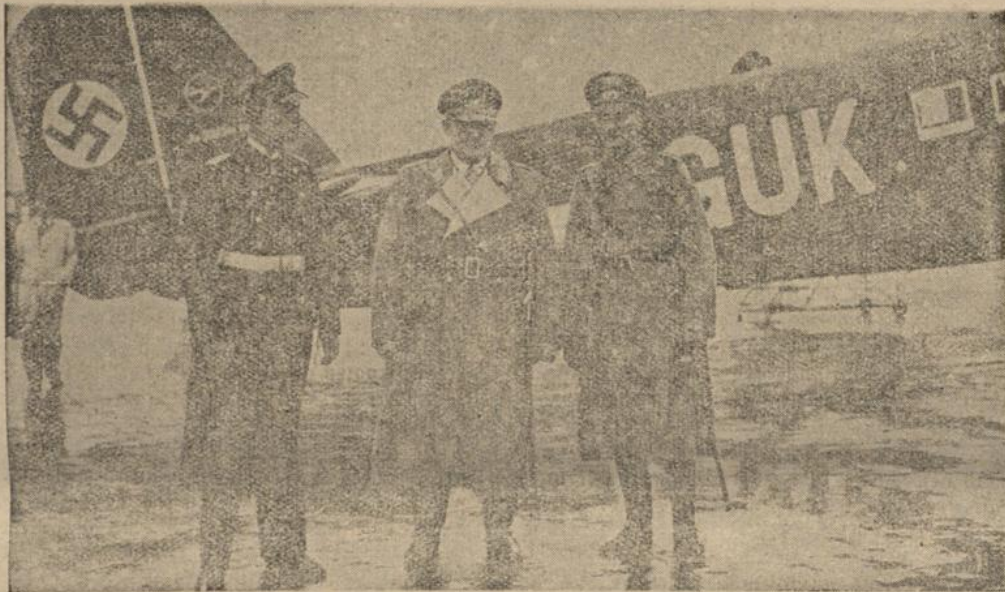
Die deutsche Trauerabordnung für Belgrad

Noch einmal wiederhole ich, daß der furchtbare Tod des ritterlichen Königs Alexander I. sowohl den Führer als auch das gesamte deutsche Volk tief erschüttert und aufrichtiges Mitgefühl erweckt hat.“