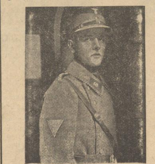
Auszeichnung für die alte Garde der SA.

Essen, 9. März. Am Sonntag, 18. März, vormittags 11 Uhr, findet am Wasserturm in Essen in Gegenwart des preußischen Ministerpräsidenten, Reichsminister General Göring und des Stabschefs der SA, Reichsminister Röhm, eine Gedenkfeier der Schutzpolizei für die in Essen bei den Spartakistenkämpfen in den Jahren 1919 bis 1923, insbesondere für die am 19. März 1923 am Wasserturm gefallenen Angehörigen der Sicherheitspolizei und der Einwohnerwehr statt.