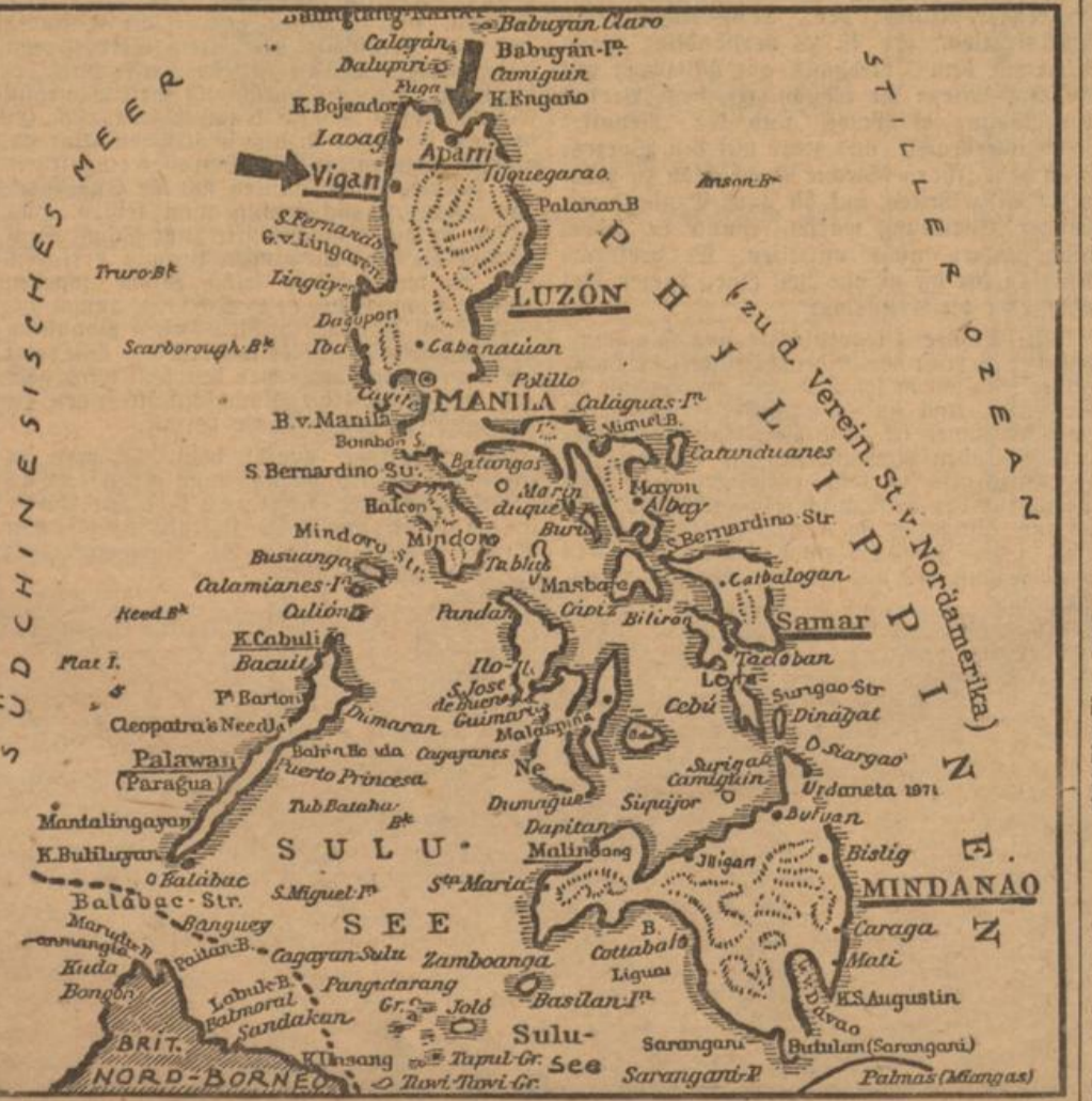
Japanische Truppen sind auf Luzon, der Hauptinsel der Philippinen, bei Vigan und Apari gelandet.

Roosevelts „Bundesgenossen“ gegen Japan. Berlin, 10. Dezember. Nach der Kriegserklärung Japans an die Vereinigten Staaten und an England am 8. Dezember erklärten an Japan folgende Staaten und Vasallen den Krieg: England, Kanada, Costarica, Australien, Nicaragua, Niederländisch-Indien (sämtliche am 8. Dezember), USA, Dominikanische Republik, Haiti, Honduras, Kuba, San Salvador, Mexiko, Panama (sämtliche am 9. Dezember), Südafrikanische Union (am 10. Dezember).