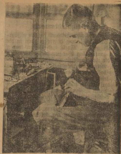
Auch er hat jetzt viel zu tun. Jeder hat nunmehr ein besonderes Bedürfnis, seine Schuhe gut zu pflegen und richtig instand zu halten. So haben die Schuhmacher heute alle Hände voll zu tun.

Für die menschliche und tierische Ernährung wie die Industrie ist das Steinsalz heute unentbehrlich. Nicht umsonst wird in salzarmen Gegenden eine Handvoll des kostbaren Minerals mit Gold aufgewogen. Deutschland ist erfreulicherweise reich an diesem Rohstoff, den eine gütige Natur in ungeheuren Mengen in die Erde eingebetet hat. Wie die Geschichte lehrt, entstanden immer um Salzquellen die ersten menschlichen Ansiedlungen und damit Brennpunkte der Kultur. Hierauf deuten alle mit „Hall“ zusammengesetzten Ortsnamen hin — es seien hier nur als Beispiele Hallstatt und Bad Reichenhall erwähnt —.