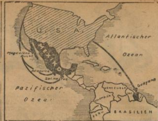
Roosevelts Griff nach Mexiko und Guayana (Köhler)

Auf den Philippinen gingen die amerikanischen Militärbehörden so weit, die Verdunkelung für jene Häfen anzuordnen, die im Dienste der amerikanischen Kriegsmarine stehen. Während damit die militärischen Vorbereitungen der USA, eifrig vorwärts getrieben werden, hat sich der philippinische