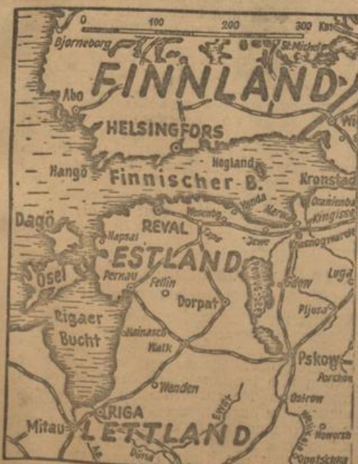
Der gesamte baltische Raum vom Feind gesäubert

Mit der restlosen Befreiung von Dagö, wo deutsche Truppen vor wenigen Tagen in kühnem Handreich Fuß faßten, ist nunmehr auch das letzte Bollwerk der Sowjets auf den baltischen Inseln gefallen.