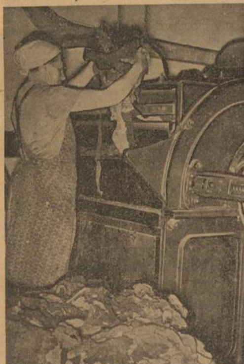
Im Lumpenstüber wird das Altmaterial einer gründlichen Reinigung unterzogen.