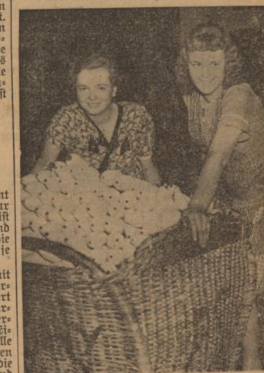
In gehäuften Körben werden die aus dem Altmaterial gewonnenen Garnspulen zum Garnlager gebracht.