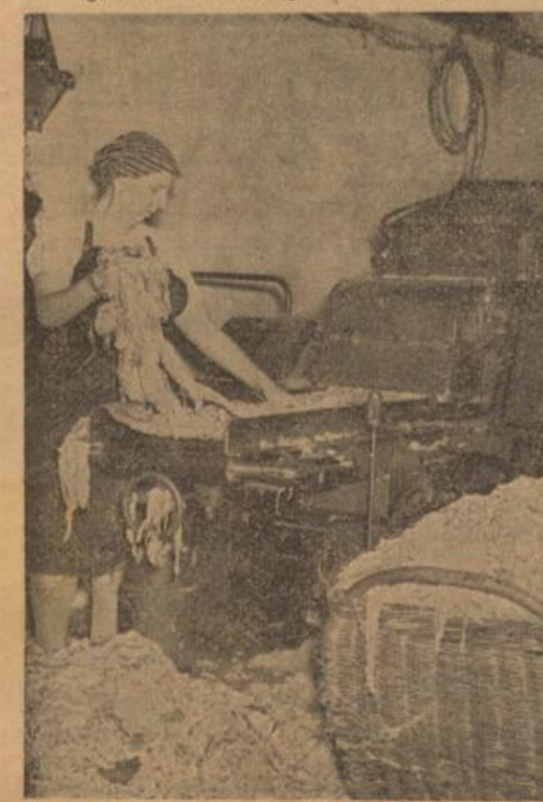
An der Reismaschine wird der Altstoff zerfasert.