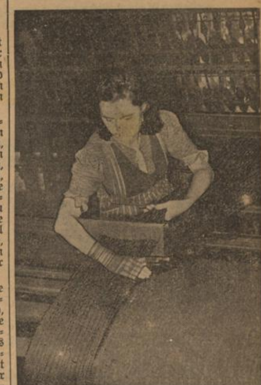
Nach dem Umspinnprozeß kann nun der neugewonnene Kettenfaden in der Kettenschermaschine für das Gewebe hergestellt werden.

Die Einsatzbereitschaft unserer Landwirtschaft läßt keinen Zweifel darüber aufkommen, daß wir unsere Kartoffelerträge auch in Zukunft halten, ja sogar wenn möglich noch steigern werden. Trotzdem aber muß die Kartoffel, gerade weil sie ein so wertvolles Nahrungsmittel darstellt, überall sorgfältig behandelt werden. Wir müssen und zwar jeder einzelne in seinem Keller, nach unseren Kartoffeln schauen und dafür sorgen, daß sie richtig gelagert sind und nicht verderben.