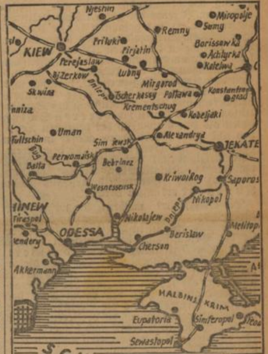
Der Kriegsschauplatz in der Südukraine

Der alte Traum, Deutschland ein weltweites Reich zu bereiten, spukt also immer noch in den Gehirnen der beiden Kriegsherrn. Churchill und Roosevelt haben ihre faulen „Kriegsziele“, einen Aufguß alter Kamellen und Phrasen, die tausendfältig widerlegt wurden, draußen auf dem Meere in einem Augenblick höchster Bedrängnis sehr eingehend ausgetüftelt. Das Wichtigste allerdings haben sie in ihrer Abschiedsrede vergessen. Sie haben gänzlich übersehen, daß zur Verwirklichung ihrer frommen Wünsche der Sieg erforderlich ist. Die beiden Weltverbesserer werden darum denen die Neuordnung überlassen müssen, die den gerechten Sieg davontragen, und das sind — Deutschland und seine Verbündeten.