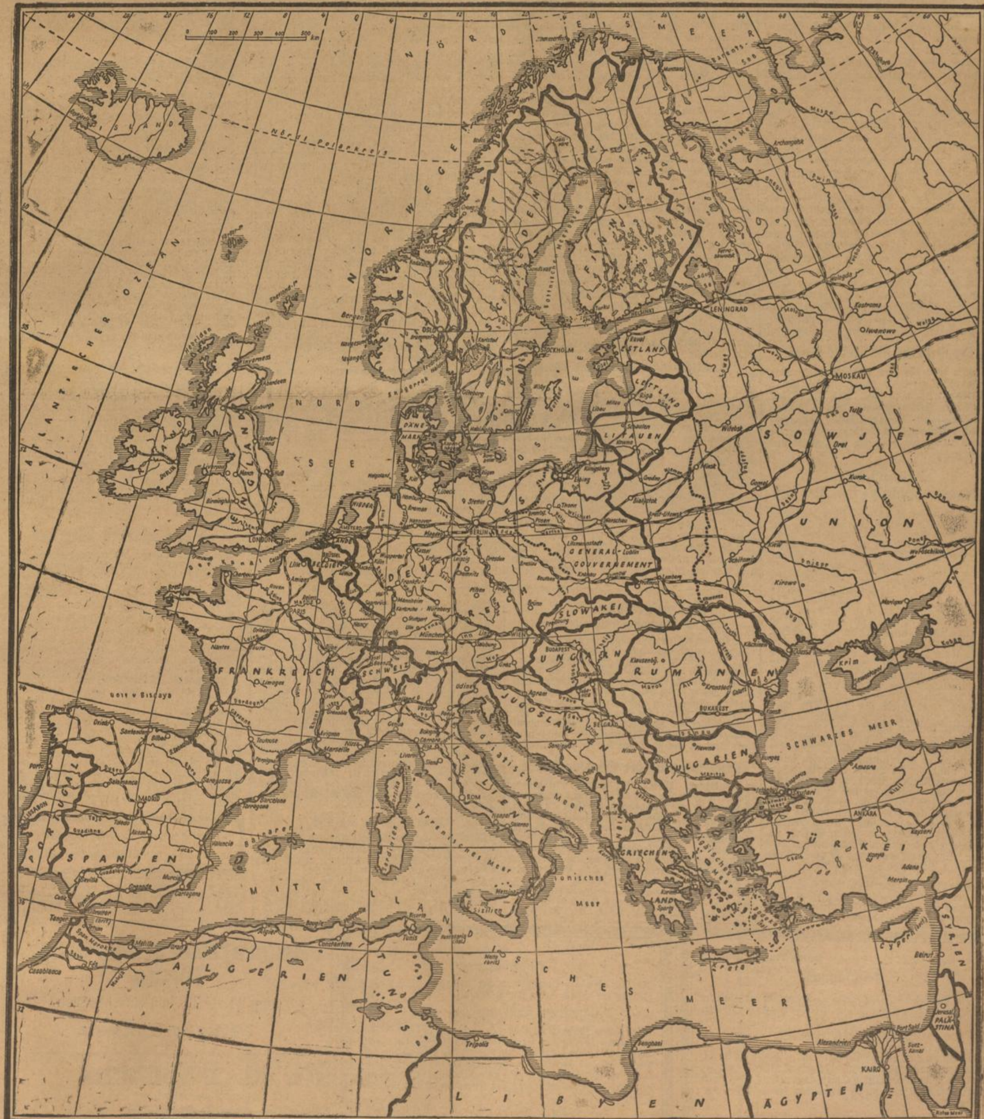
Unser Kartenbild zeigt den Verlauf der gewaltigen Front im Osten. — Die von Rußland vergewaltigten Baltischen Staaten Litauen, Lettland und Estland sind noch eingezeichnet.