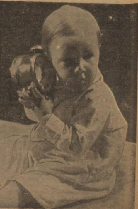
Wird er mich auch morgen rechtzeitig wecken?

Eine wirkliche Frau braucht doch gar keine besonderen Gesetze; denn alle ihren großen Rechte ruhen schon in ihrem Geschlecht und Wesen. - Aber wir wollen das nicht so laut sagen - es ist besser, sie weiß das nicht. T. S. A.