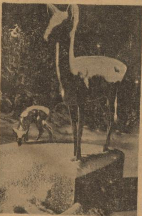
Rehe im Schnee. Diese Reheplastik wirkt in der winterlichen Umgebung so natürlich, daß man...

Es wäre eigentlich selbstverständlich, daß geputzte Streichholzschachteln nicht auf den heißen Herd gehören. Und doch sind Unfälle dadurch an der Tagesordnung So verlor eine Frau ihr Augenlicht weil sie in dem Augenblick wo sie sich über den Kochtopf bückte, neben ihr eine Streichholzschachtel explodierte Kein Ende nehmen die Unfälle durch Nachlässigkeiten von Erdöl und Spiritus in verlockendes Feuer Gewöhnlich ist nur die mangelnde Ueberlegung wie man es am vorzüglichsten machen könne, an den Unfällen schuld Es kann beispielsweise gar nichts geschehen wenn man auf die Kohlenhaufen etwas Ache gibt sie mit Erdöl tränkt und dann ins verblimmende Feuer wirft. Der Zweck wird vollkommen erfüllt und keine Stichflamme kann der Erdöl- oder Spiritusfahne gefährlich werden, weil man sie längst weggelassen hat Auch mit Benzin wird immer noch leichtfertig umgegangen. Es ist ausgerechnet worden daß das Gas eines Viertelliters Benzin genügt um in der Küche nicht einen Stein auf dem anderen zu lassen Vor allen Dingen sei darauf nie vergessen daß jedes Gas das Verbrennen nach weitem Ausdehnen in sich hat; man glaube deshalb nicht, weil annua vom Feuer entfernt es mit dem