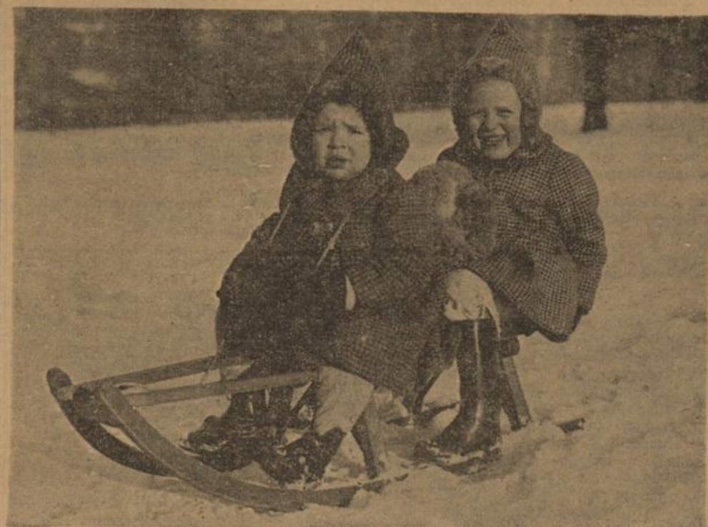
Süß und Sauer führen einst mit dem Rodelschlitten, doch es dauerte nicht lang bis die beiden stritten.

Das ist nur einiges von vielem aus dem täglichen Leben Eine kleine Gedankenlosigkeit an und für sich bringt oft recht unangenehme große Folgen mit sich. L. Richard