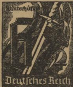
Wertezeichen der Winterhilfswerk-Postkarte