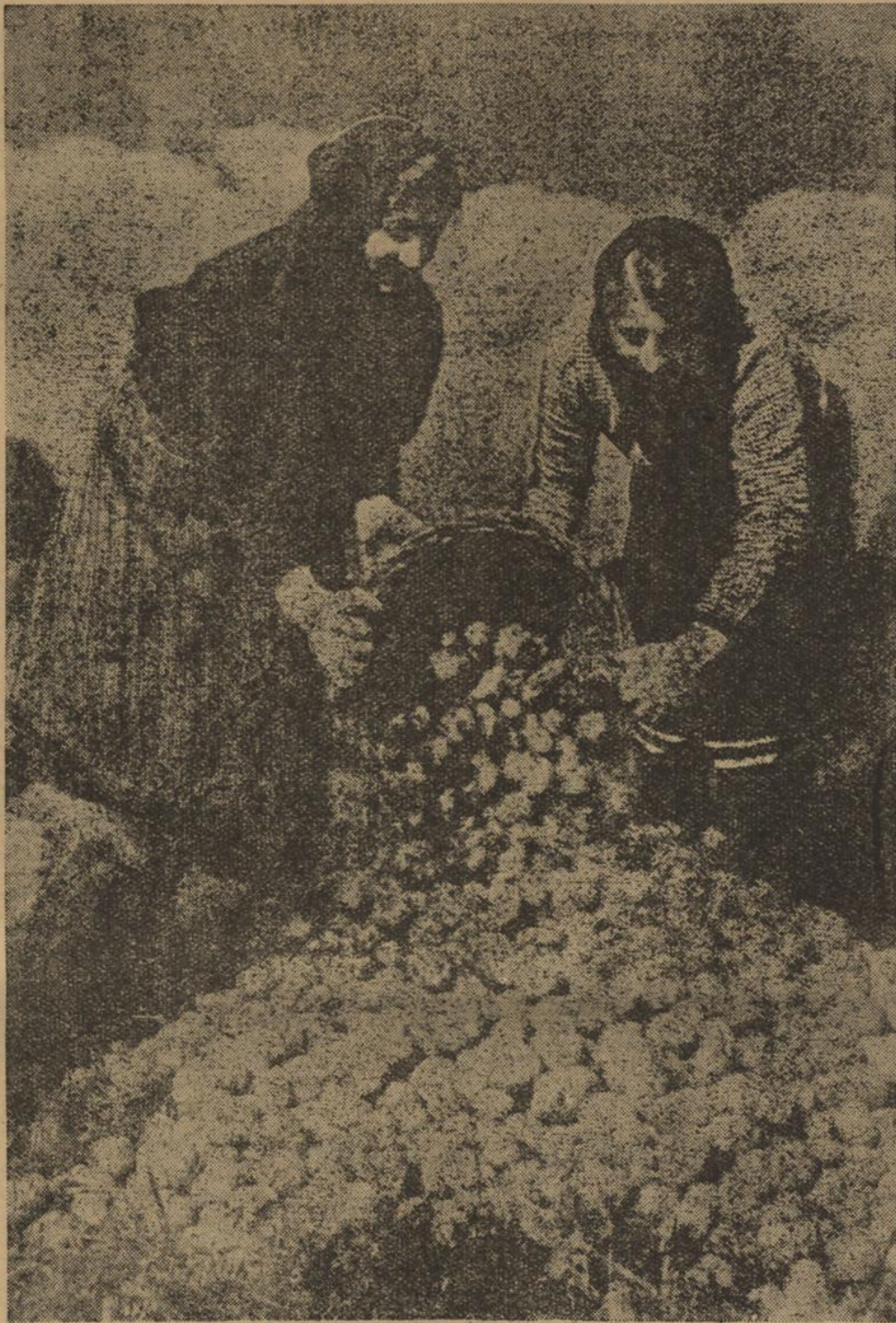
Reichlich und gut ist heuer unsere Kartoffelernte

Biorzheim. Beim städt. Saalbau machte ein Polizeibeamter bei der Verfolgung eines flüchtenden Burschen von seiner Dienstwaffe Gebrauch. Unglücklicherweise wurde hierbei ein unbeteiligter Fußgänger in den Oberarm getroffen und ihm die Schlagader verletzt. Der Verletzte wurde in das städt. Krankenhaus gebracht, wo er bald darauf starb.