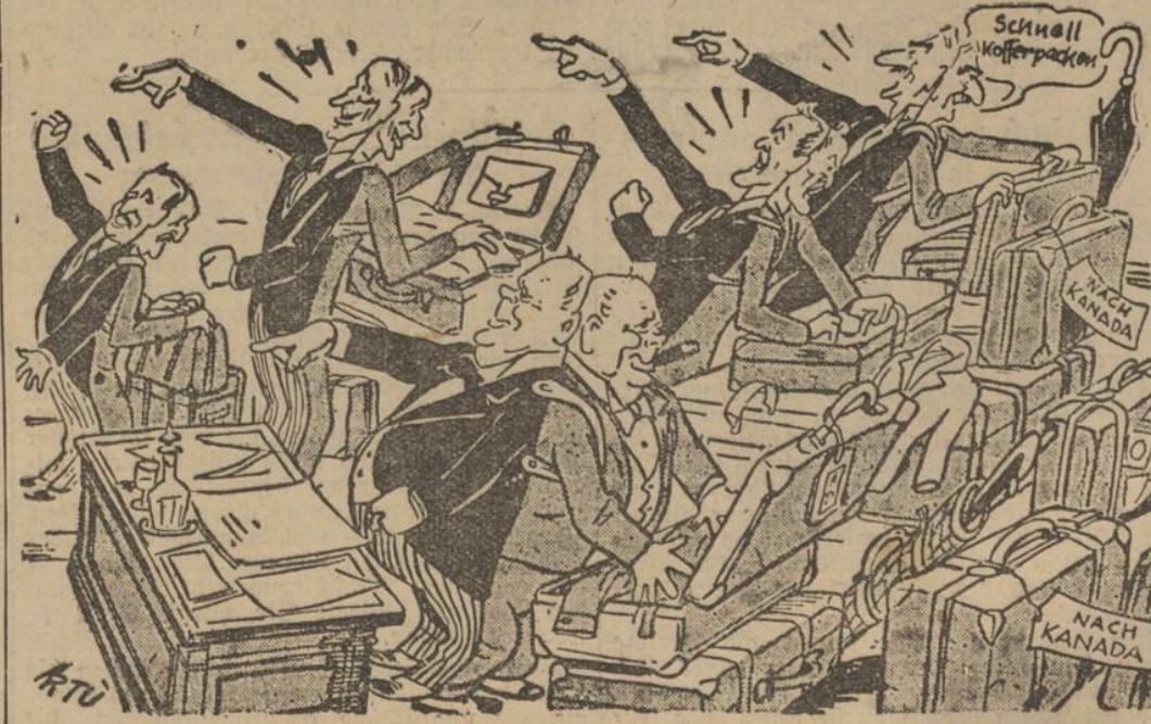
Vom Heldennut plutokratischer Brandstifter oder: Die Reverso der Medaille Vor der Öffentlichkeit: „Wir werden England bis zum letzten Tropfen Blut verteidigen!“ Im trauten Heim: „Laßt uns geschwind für Kanada die Koffer packen!“

Die englische Propaganda entleibt sich ihrer wie immer mehr undankbaren Aufgabe, indem sie mit schlecht gespielter Gleichgültigkeit erklärt, Britisch-Somaliland habe keine militärische Bedeutung. In Wirklichkeit beurteilt England die Ansichten des Afrikastrategie pessimistisch. Das bestätigt nicht nur der Eindruck der schwedischen Beobachter in England, das geht auch aus den englischen Pressestimmen hervor. „News Chronicle“ schreibt recht kritisch gegen die Regierung Churchill: „Afrika kann zu der langen Liste von Kriegsschauplätzen gerechnet werden, in der wir dem Feind die Initiative überlassen haben.“