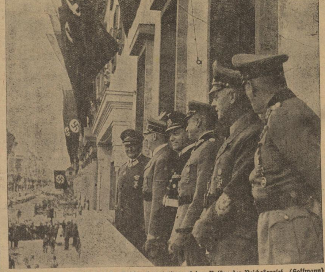
Der Führer, seine Generale und der Reichsaussenminister auf dem Balkon der Reichskanzlei (Hoffmann)