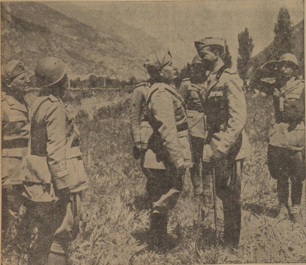
Der Duce und Kronprinz Umberto in der vorgehobenen italienischen Zone

rd. Den Haag, 9. Juli. Die ausländischen Diplomaten, die bisher noch ihren Sitz in Den Haag hatten, werden am 15. Juli die Niederlande verlassen. Außer den diplomatischen Vertretern werden alle Beamten und Angestellten der Gesandtschaften, einschließlich der Familienangehörigen und des Dienstpersonals, soweit es fremder Nationalität ist, in die Heimatländer zurückzuführen