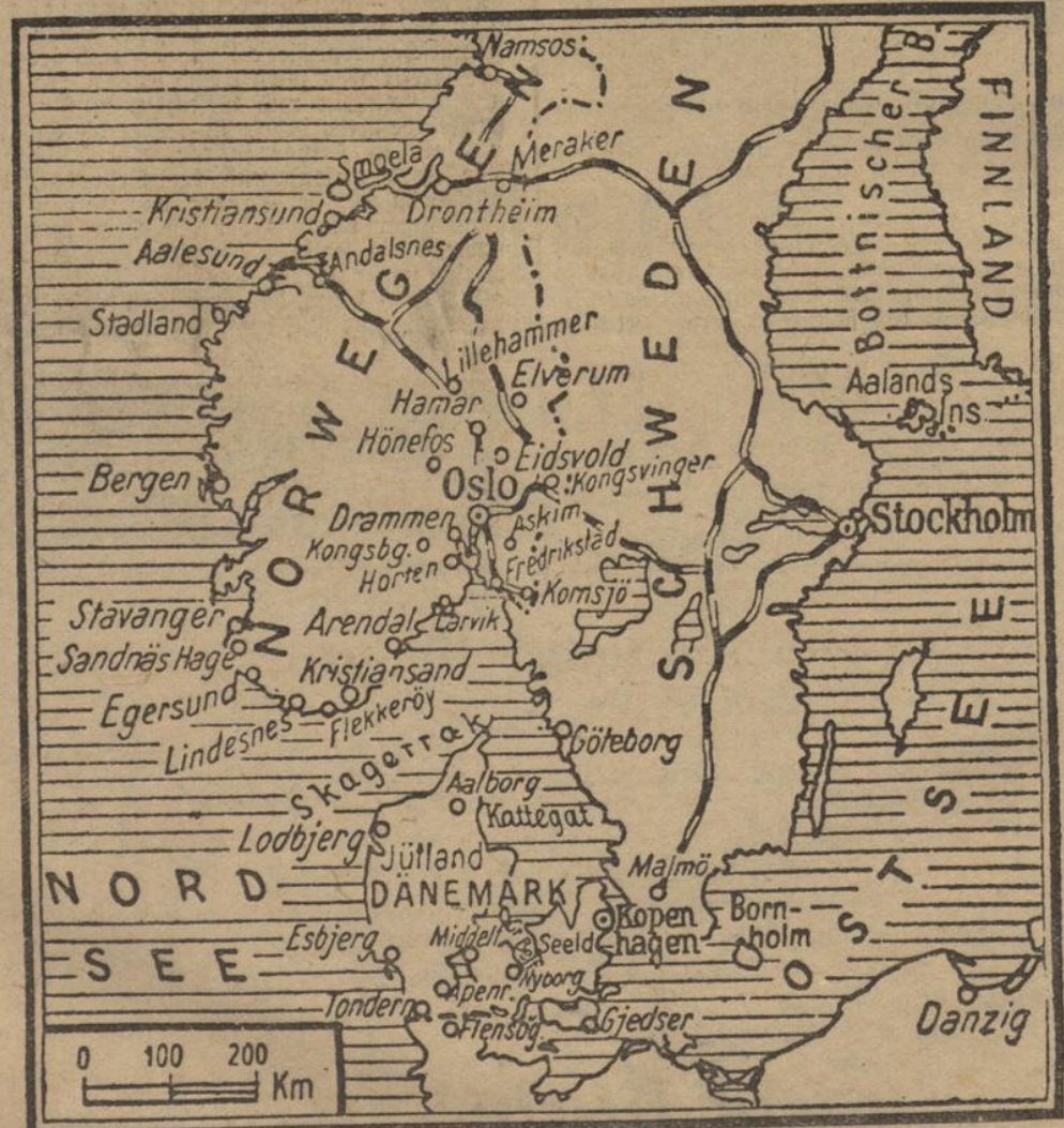
Unsere Karte zeigt die in diesen Tagen von den Berichten des ORW. genannten Orte

Auch in Moskau haben die bedeutenden Verluste der Engländer in Norwegen großes Aufsehen erregt. Alle Moskauer Zeitungen berichten darüber. Man ist allgemein der Ansicht, daß die starken Verluste an Kriegsschiffen, die England innerhalb von zwölf Tagen erlitten hat, am besten alle feindlichen Lügenmeldungen über die Kampfhandlungen widerlegen. Ein gut informierter Berichterstatter des „Popolo d'Italia“ berichtet, durch ihre zerstörten Landungen hätten die Engländer und Franzosen ihren guten Willen beweisen wollen, ohne jedoch nach den äußerst schweren Verlusten, die sie überall erlitten hätten, noch weitere Kriegsschiffe aufs Spiel zu setzen. Die norwegische Widerstandslinie bei Samar und Elverum sei neuerdings weiter nach rückwärts verlegt worden, anscheinend nicht nur aus strategischen Gründen, sondern weil die Deutschen schnell vorrückten.