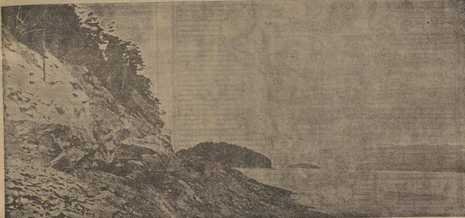
Deutsche Infanterie, die an einem Bergwald im Tyfsefjord vorgeht und jede Bodendeckung geschickt ausnützt