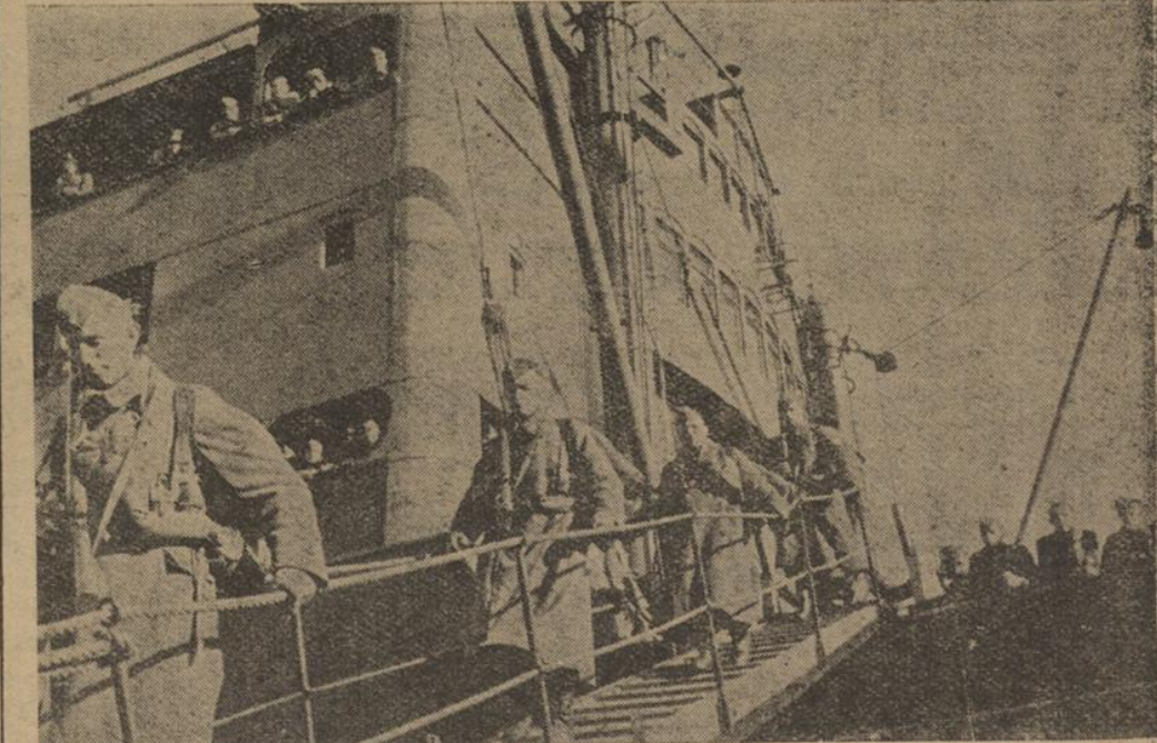
Transportdampfer mit deutschen Fliegern an Bord in einem norwegischen Hafen

„Es ist sehr lieb von Ihnen; aber sicher benötigen Sie den Schöfför selbst.“