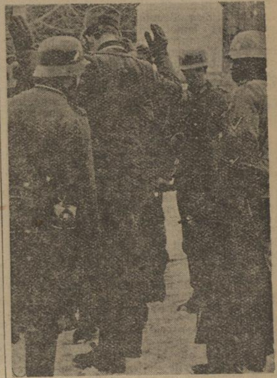
Entwaffnung von Norwegern beim Vormarsch. Hier wurde eine Gruppe von Norwegern während des Vormarsches der deutschen Truppen in Norwegen gestellt und entwaffnet

Mag der deutsche Soldat so die Genugung haben, von der menschlich-personlichen Seite her den Gegner überwunden zu haben, so vermag er aber dennoch nicht die Wahrheit und — notfalls — den Beweis seiner militärischen Kraft. Der angetroffene Widerstand, norwegischer regulärer Truppen und irregulärer Freischaren wird gebrochen. In vielen Scharmüheln und Gefechten mühten die zum Feinde gewordenen Norweger die Schärfe der deutschen Klinge spüren. Am Tyrifford (siehe Bild unten) und im Dextendal, bei Sollihogda und bei Sander, vor Halden und Kongsvinger hat das deutsche Meer auch im norwegischen Feldzug bereits überzeugende Beweise seiner Kraft gegeben. „Tyst Krigsmakt“ ist ein Wort, das auch nach dieser Richtung Klang und Ruf besitzt. Kieckheben-Schmidt