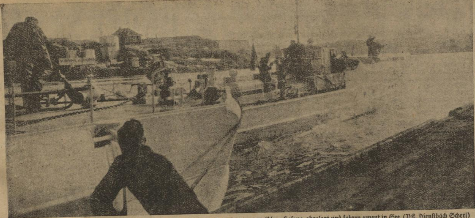
Schnellboote der deutschen Kriegsmarine haben Soben vom Landungssteg eines norwegischen Hafens abgelegt und fahren erneut in See