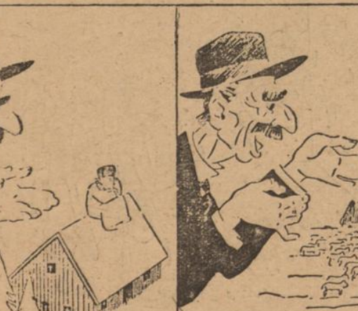
„Gibt uns wieder Waffen, wir zahlen dann nach dem Kriege!“