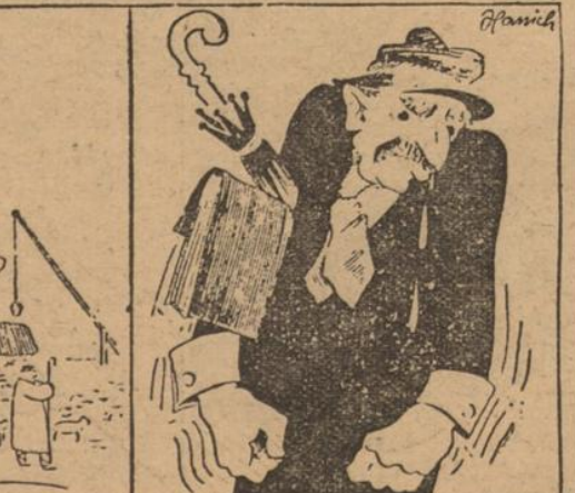
„Schließt euch den Westmächten an, wir garantieren eure Freiheit!“