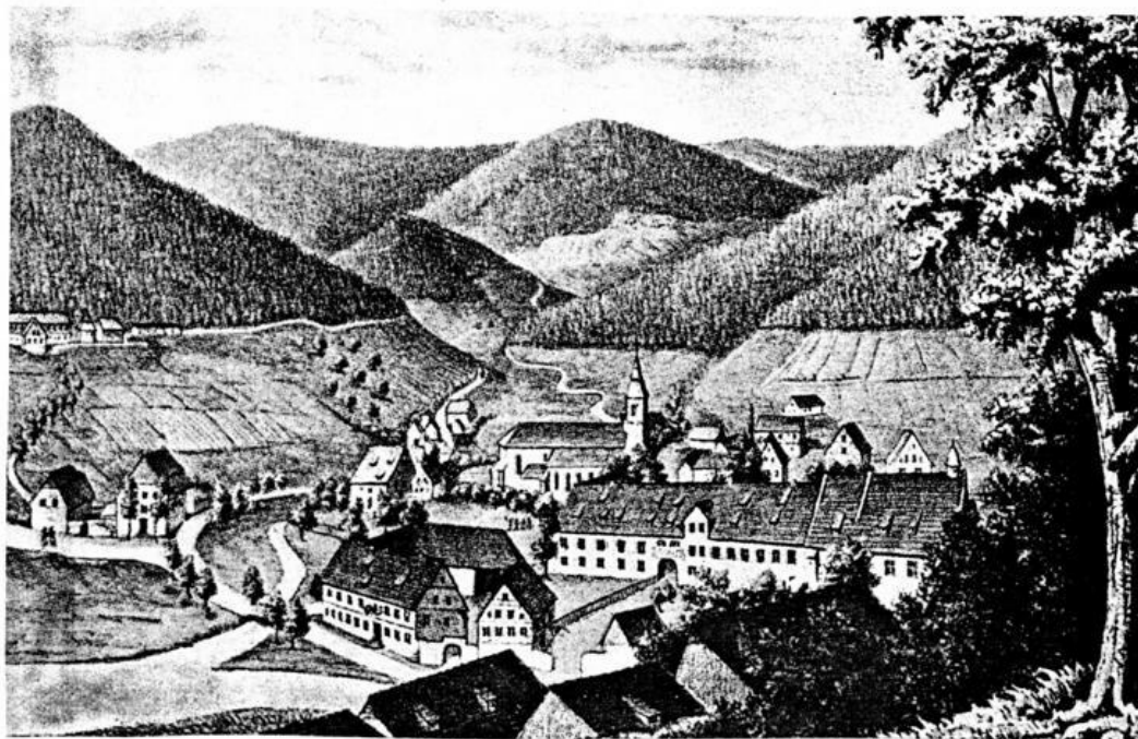
Abbildung 12: Kloster Herrenalb ( nach einer alten Lithographie ) aus: Seilacher, C.: Herrenalb

In seiner Blütezeit im Spätmittelalter besass das Kloster Herrenalb, wie die meisten anderen Klöster jener Zeit, grosse Besitzungen in der Umgebung, die es durch Kauf oder Schenkung von Adligen erwarb und die das Einkommen des Klosters gewährleisteten. Neben Maulbronn galt Herrenalb als reichste Abtei des Landes, deren Einfluss weit über den württembergischen Raum hinausreichte. Jedoch beschränkte sich die Bedeutung des Klosters hauptsächlich auf die kirchliche Tätigkeit. Auf die Besiedlung hatte das Kloster Herrenalb keinen Einfluss, da die meisten umliegenden Dörfer älter waren als das Kloster. Auch im politischen Bereich hatte das Kloster keinerlei Bedeutung.