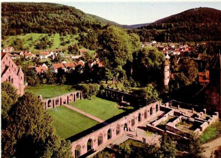
Abbildung 11: Die Ruinen der ehemaligen Klosteranlage

Das neue Kloster wurde 1091 vollendet und später weiter ausgebaut. Z. B. sind die Ruinen des in späterer Zeit entstandenen spätgotischen Kreuzgangs noch mit am besten erhalten. Trotzdem erlebte das Kloster in den Folgejahrhunderten einen geistigen und wirtschaftlichen Niedergang und verlor bis zum Jahr 1500 einen grossen Teil seiner ehemaligen Besitztümer. Nach der Reformation wurde das Kloster aufgelöst, 1692 wurde es durch die Truppen des französischen Generals Melac zerstört.